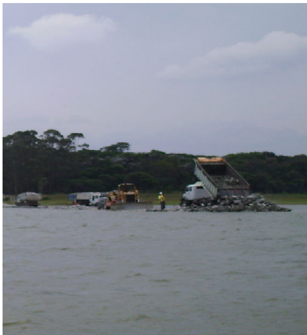
Figura VIII – caçambas jogam pedras dentro da represa.