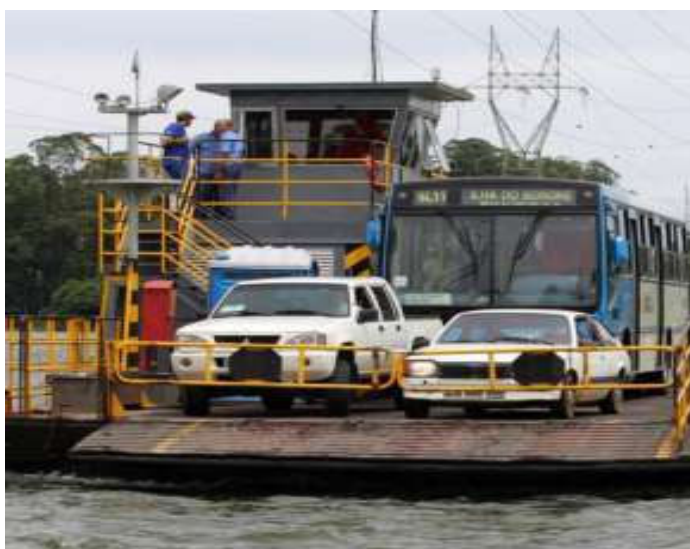
Figura VI – travessia na Balsa de Grajaú para Ilha do Bororé

As pequenas mudanças ocorridas no território Ilha do Bororé, foram resultados de uma organização planejada, com consciência política que perceberam a injustiça através da discriminação, se colocaram com propostas concretas no enfrentamento das questões do cotidiano.