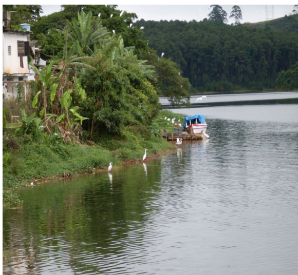
Figura I - Casa do Pescador com as Garças

É possível encontrarmos animais pastando soltos aves, barcos de pescadores ancorados em suas encostas. Também é comum encontrarmos répteis, anfíbios e animais selvagens, alguns em extinção como: os macacos, bugios e os pássaros jacus. Os esquilos eram abundantes e deram nome a uma rua.