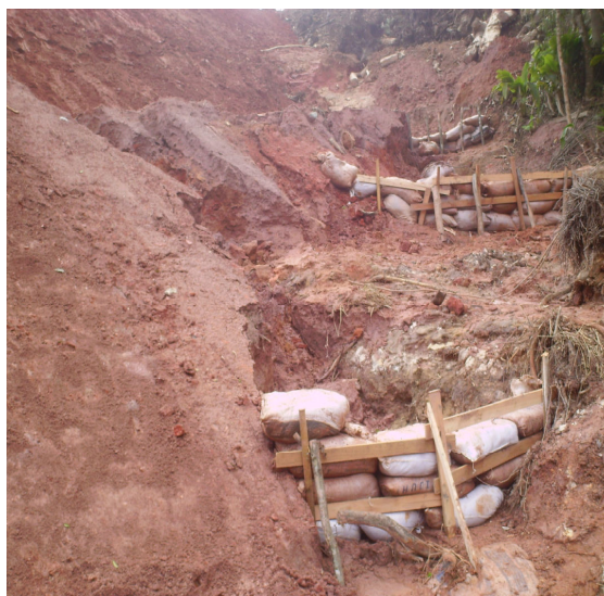
Figura IV – tentativa de proteção à nascente.

A Ilha do Bororé é um bairro formado por pequenos núcleos, distantes uns dos outros. Na Ilha do Bororé temos duas Igrejas Católicas, seis Evangélicas e dois Centos de Cultura Africanos. Uma Igreja Católica está localizada na primeira balsa tem mais de um século e foi tombada pelo patrimônio histórico, hoje é atração turística, a comunidade de São Sebastião. A outra está localizada no Jardim Borba Gato, comunidade de Santa Bárbara, essa é nova e teve a participação desses atores sociais.