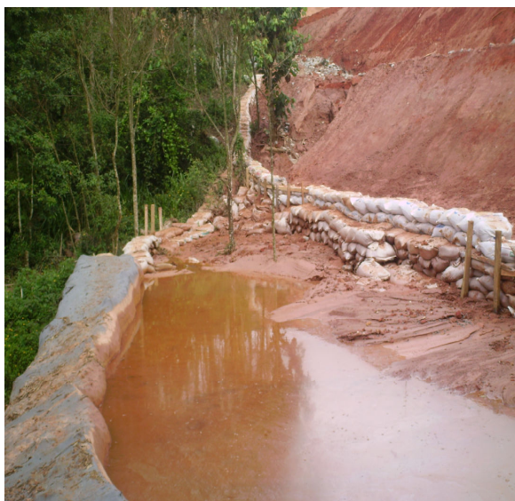
Figura III – nascente destruída pelo RODOANEL

Hoje o bairro esta dentro de uma área de preservação ambiental (APA). Conquista dos moradores, sociedade civil, e poder público, foram possíveis à criação da APA. 80% do verde estão preservados. Embora esse número tenha caído esse ano com a passagem do RODOANEL do Mario Covas dentro da Península.