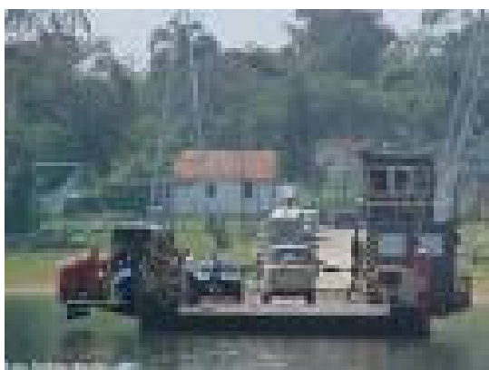
Figura VII – ao fundo sede da ECOATIVA Fechada por interesses particulares.

Hoje a casa de cultura aberta pela ONG está fechada por interesses que desrespeitam aos anseios da comunidade. Interesses particulares solicitaram a casa para ser um centro de recepção ao turismo, mas a comunidade não permitiu esta utilização. Não conseguindo implantar o centro de recepção após muita luta da comunidade, requisitaram a casa para sediar a Guarda Civil Metropolitana – novamente contrariando as necessidades e os anseios da comunidade.