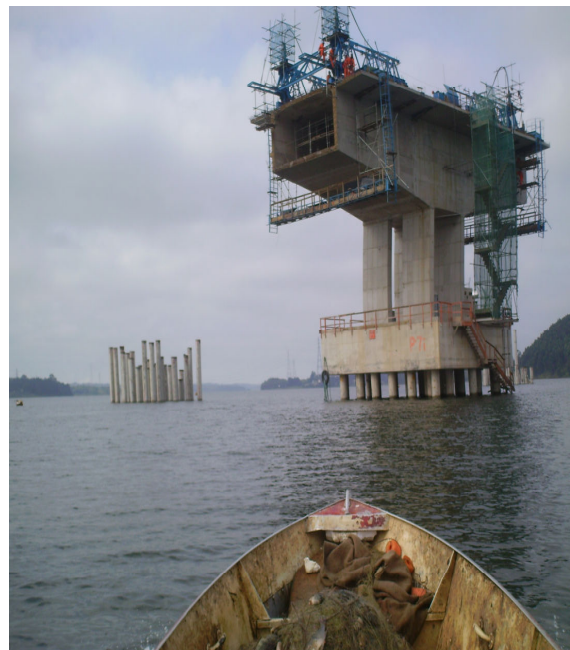
Figura IX – pilastras do RODOANEL.