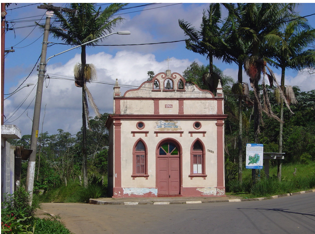
Figura V - Igrejinha de São Sebastião, fundada em 1904, tombada pelo patrimônio histórico.

O bairro não é novo, pois a Igreja de São Sebastião é do século passado e foi tombada pelo patrimônio histórico, em 2006, após 104 anos de existência.