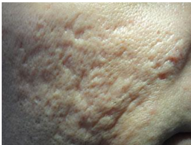
Figura 1. Cicatriz atrófica.