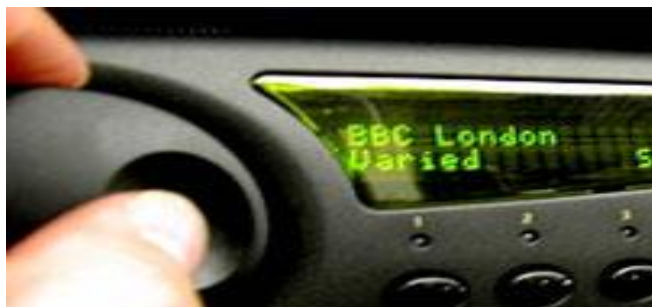
Figura 4 - Aparelho de rádio digital automotivo