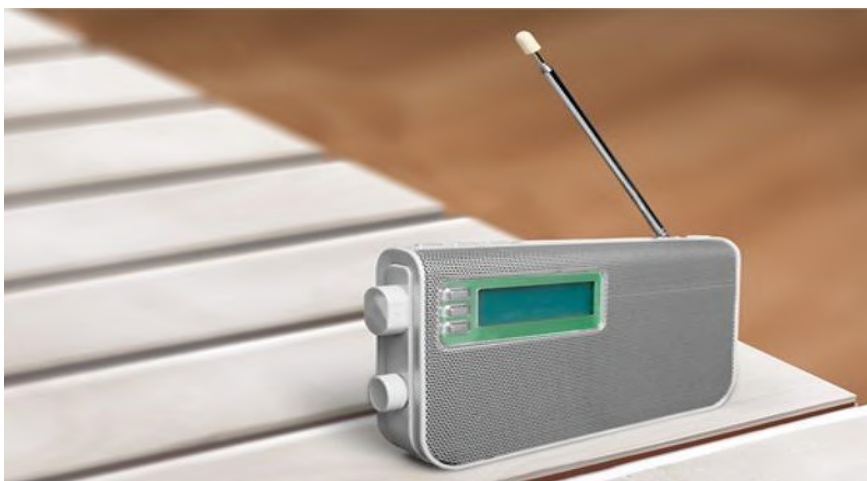
Figura 2 - Aparelho de rádio digital