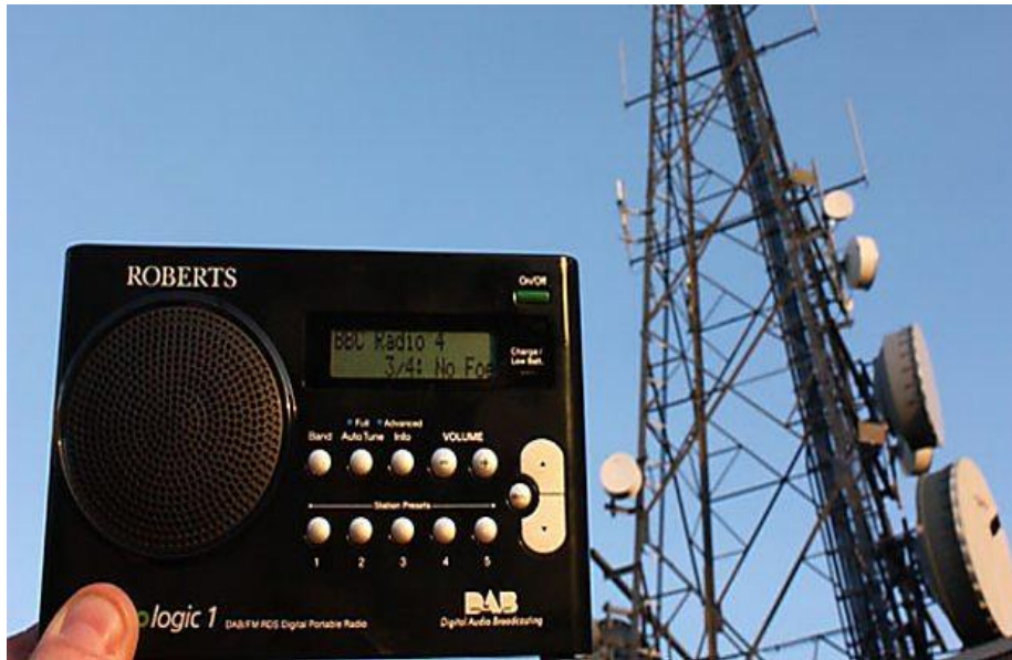
Figura 3 - Aparelho de rádio digital