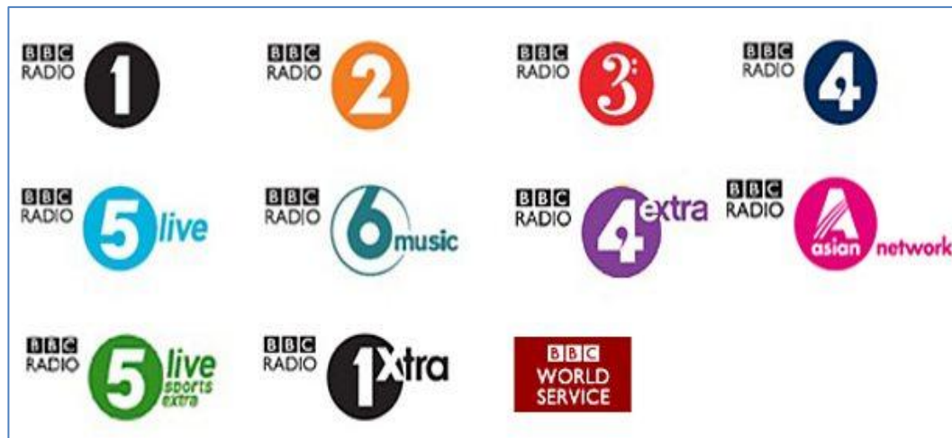
Figura 5 - Estações da rádio digital da BBC de Londres