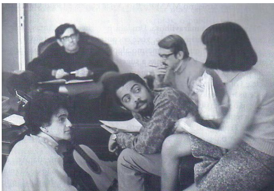
Figura 2 - Reunião dos tropicalistas no apto. 112 do Hotel Danúbio

Os tropicalistas deram um histórico passo à frente no meio musical brasileiro. A música brasileira pós-Bossa Nova e a definição da “qualidade musical” no País estavam cada vez mais dominadas pelas posições tradicionais ou nacionalistas de movimentos ligados à política.