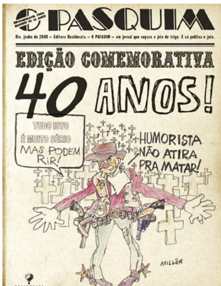
Figura 4 - O Pasquim - Edição Comemorativa

Assumidamente “alternativo”, O Pasquim representou, para uma parcela da classe média brasileira descontente com a ditadura militar, um veículo de crítica bem humorada à repressão política e ao conservantismo moral, sobretudo no período geralmente caracterizado como “ano de chumbo”.