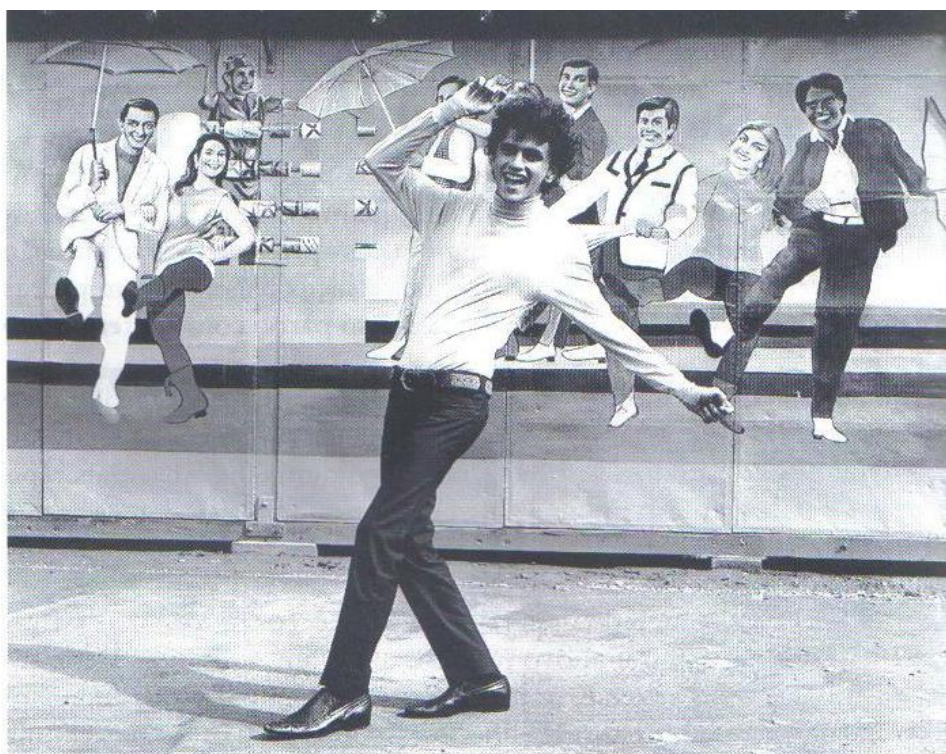
Caetano posando para revista Manchete , logo após o sucesso de Alegria, Alegria

Irreverente, a Tropicália transformou os critérios de gosto vigentes, não só quanto à música e à política, mas também à moral e ao comportamento,