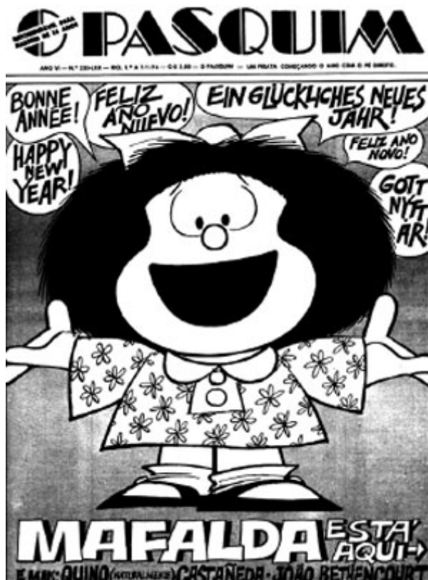
Figura 6 – O Pasquim - Mafalda

Papel essencial ao conferir inteligibilidade a textos que, muitas vezes, devido às pressões externas, continham mensagens cifradas ou obscurecidas pelo uso de figuras de linguagem e outros recursos criados e utilizados para confundir os censores. No entanto, a irreverência e o humor que caracterizam a formatação das mensagens não foram capazes de impedir a repressão de intervir no jornal, cada vez com maior virulência, Muito pelo contrário, a forma debochada com que os articulistas encaravam cartas medidas governamentais provocou a ira de seus representantes, os quais impuseram represálias através de formas legais ou ilegais, culminando com a prisão no dia 30 de outubro de 1970, de quase todos os integrantes do jornal pelo DOI-Codi, os quais permaneceram encarcerados durante dois meses.