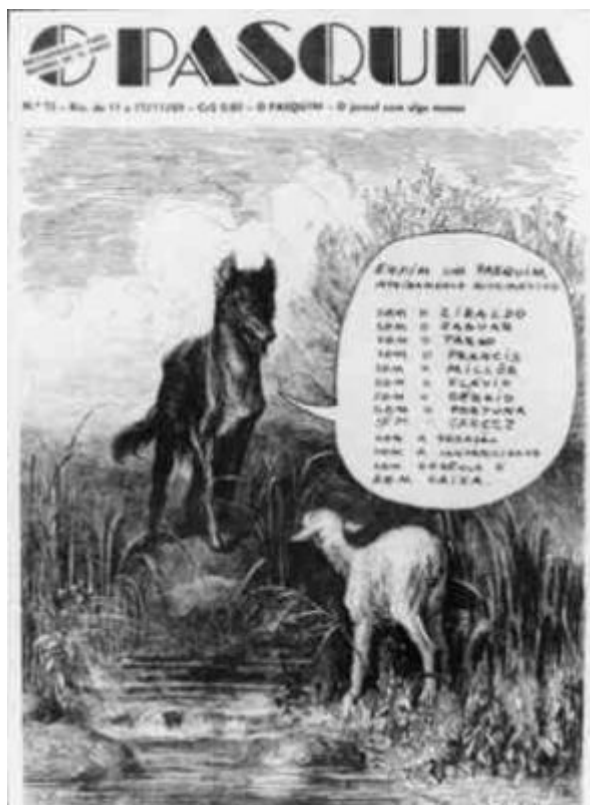
Figura 5 - O Pasquim

Edição nº 73, Rio de 11 a 17 nov de 1969