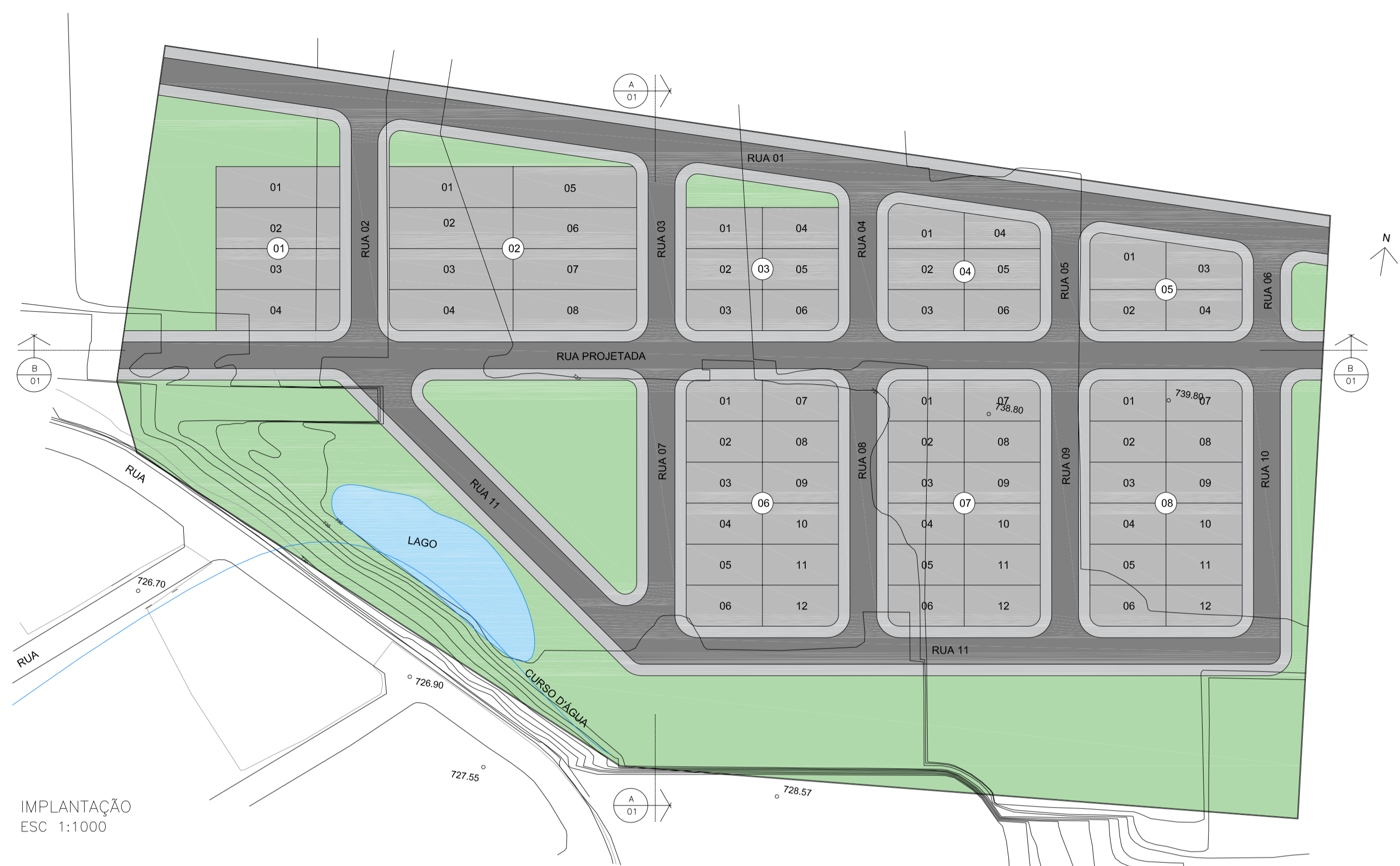
IMPLANTAÇÃO ESC 1:1000