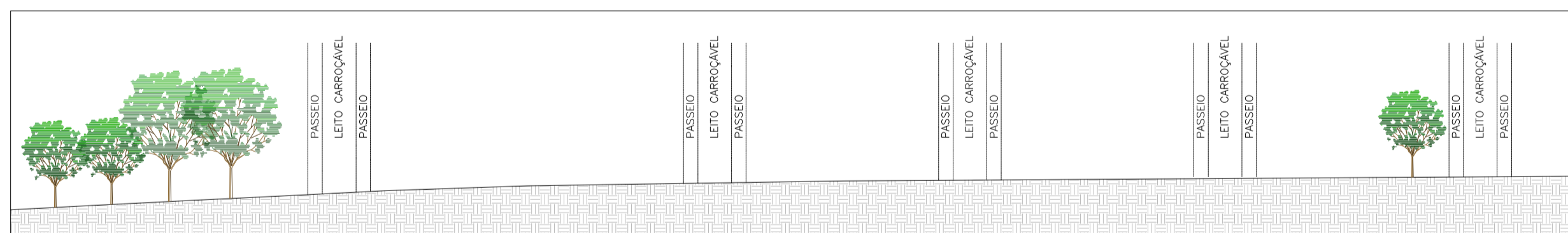
CORTE B ESC 1:1000