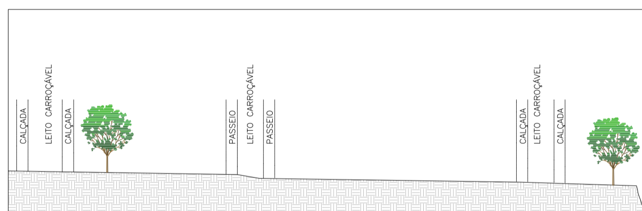
CORTE A ESC 1:1000