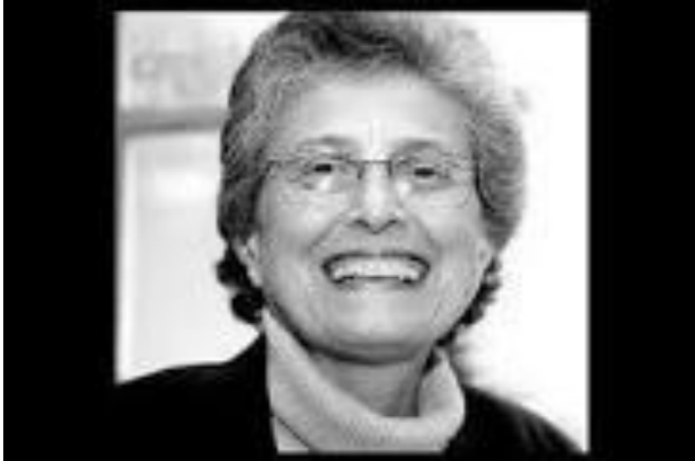
Figura 1 - Ivone Gebara