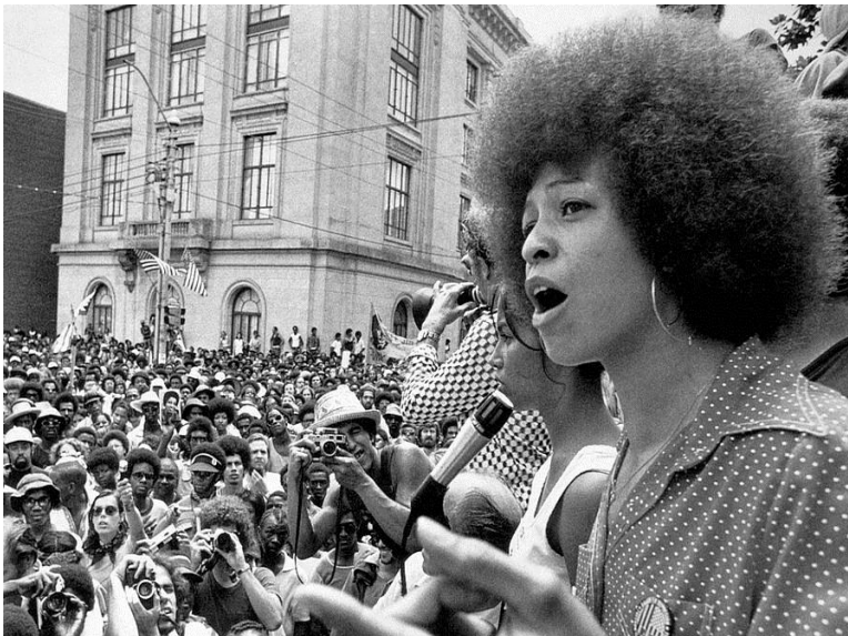
Figura 2 - Angela Davis

Angela Davis é ativa militante em favor da igualdade de gênero e dos direitos da população negra. Diz: “minha concepção do feminismo é a de uma emancipação que vai além das fronteiras estabelecidas. As questões de sexualidade, de raça, de classe e de gênero estão intimamente ligadas”. Ficou conhecida internacionalmente por ter sofrido intenso processo de perseguição política nos anos 1970, nos Estados Unidos, quando atuava nos Panteras Negras, organização revolucionária marxista criada para a autodefesa dos negros contra a violência policial.