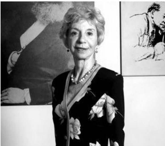
Figura 5 - Heleieth Saffioti

Heleieth Saffioti , conhecida internacionalmente como uma das mais importantes pesquisadoras feministas do país. Seus estudos sobre a situação das mulheres no mercado de trabalho no Brasil, desde a década de 1960 são pioneiros na análise sobre as desigualdades entre mulheres e homens, nas diversas formas de opressão e exploração no trabalho. Faleceu em dezembro de 2010, em São Paulo.