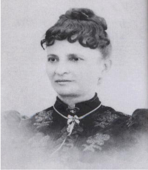
Figura 4 - Nísia Floresta