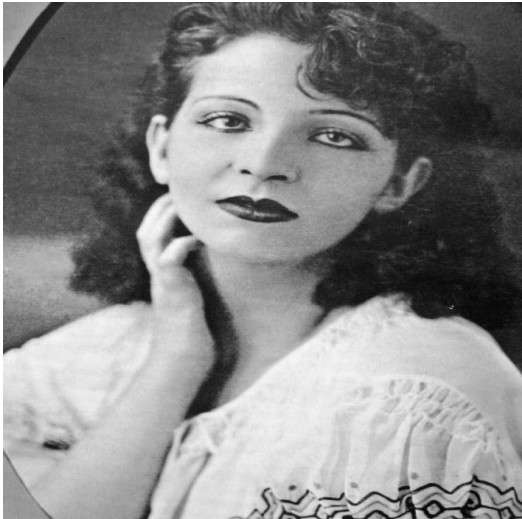
Figura 6 - Patrícia Galvão

Pagu , cujo nome é Patrícia Galvão defendeu a libertação sexual da mulher e a busca por sua auto-suficiência amorosa. Como jornalista era ainda mais contundente. Escreveu pela primeira vez sobre a condição feminina das mulheres das classes menos privilegiadas em São Paulo. Faleceu em 12 de dezembro de 1962, em Santos - São Paulo.