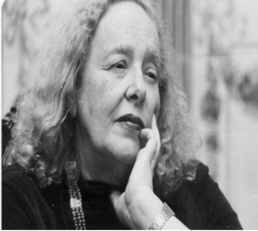
Figura 7 - Rose Marie Muraro Fonte: (Google).