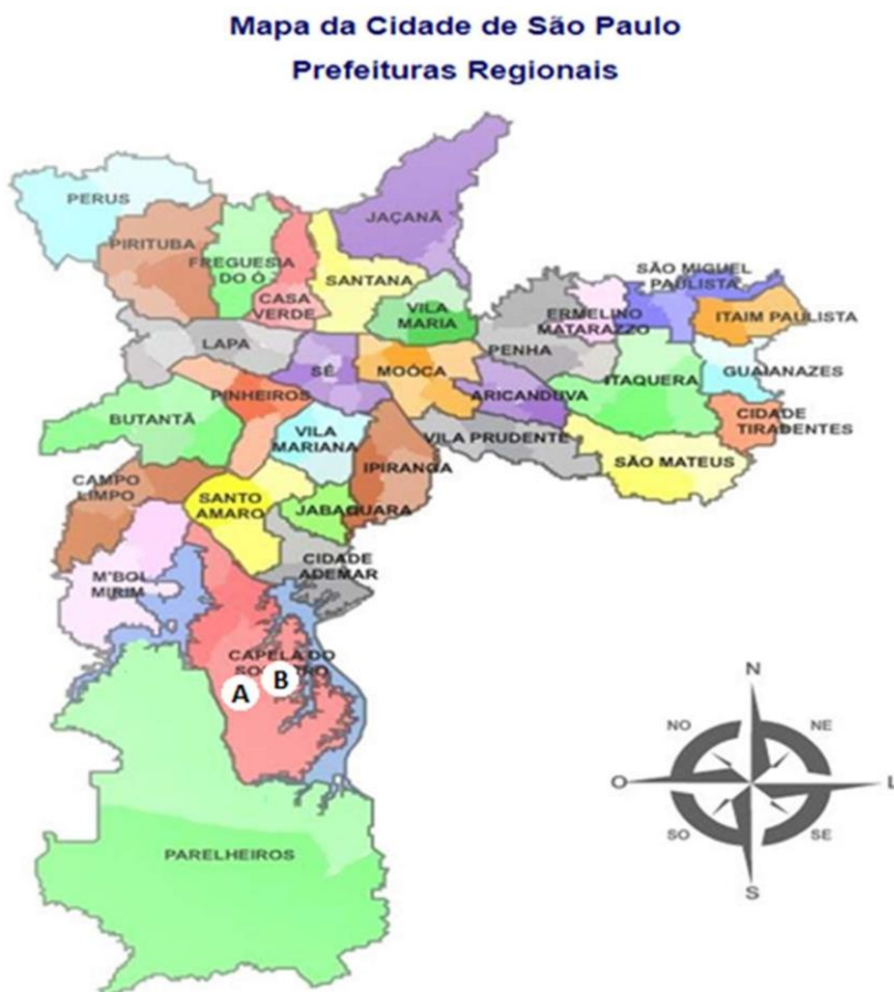
Figura 1 – Mapa da Cidade de São Paulo e as Prefeituras Regionais

Como hospital de referência secundária para a população da Capela do Socorro, está o Hospital de Ensino onde o presente projeto foi conduzido.