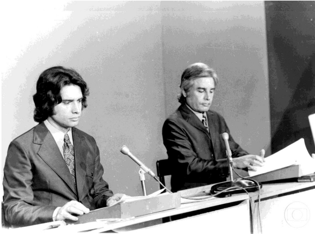
Foto 5 – Sérgio Chapelin e Cid Moreira no Jornal Nacional , em 1972.