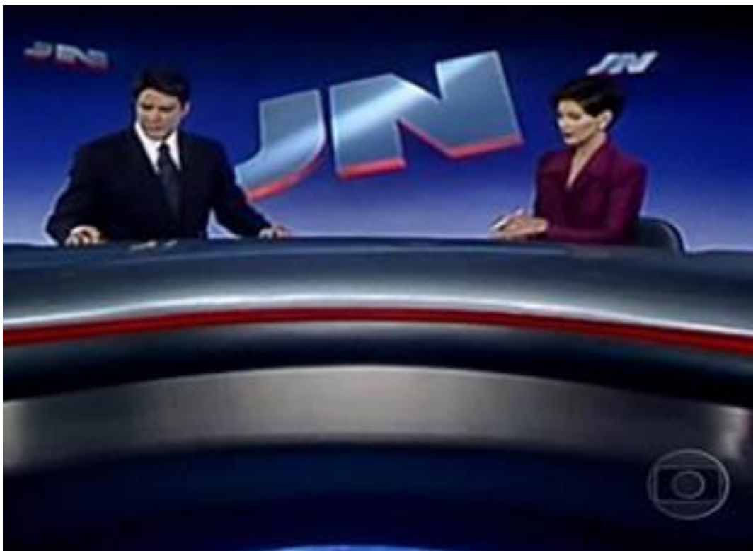
Foto 8 – William Bonner e Fátima Bernardes no Jornal Nacional , em 1998.