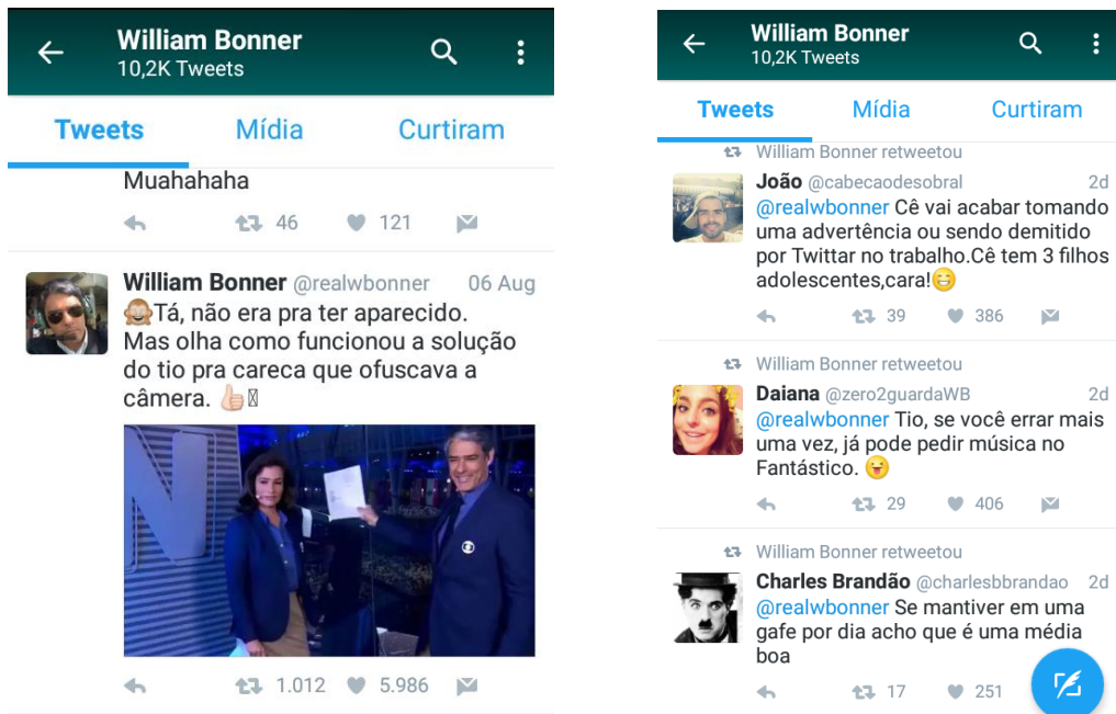
Foto 14 – Prints da repercussão no Twitter da falha de William Bonner no Jornal Nacional .