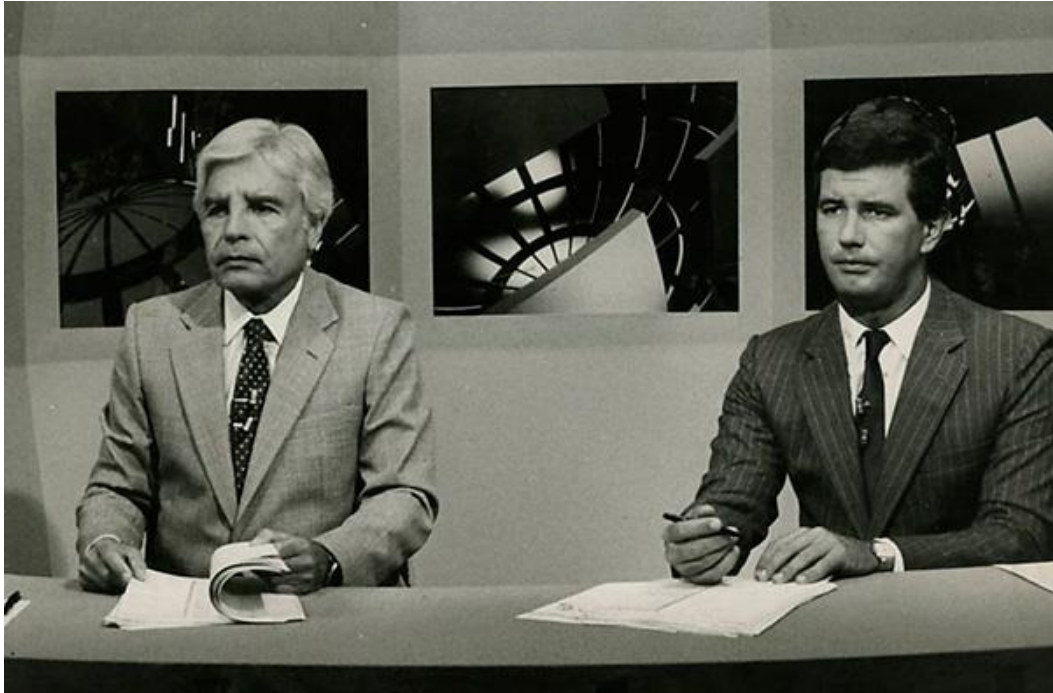
Figura 6 – Cid Moreira e Celso Freitas no Jornal Nacional , em 1983.