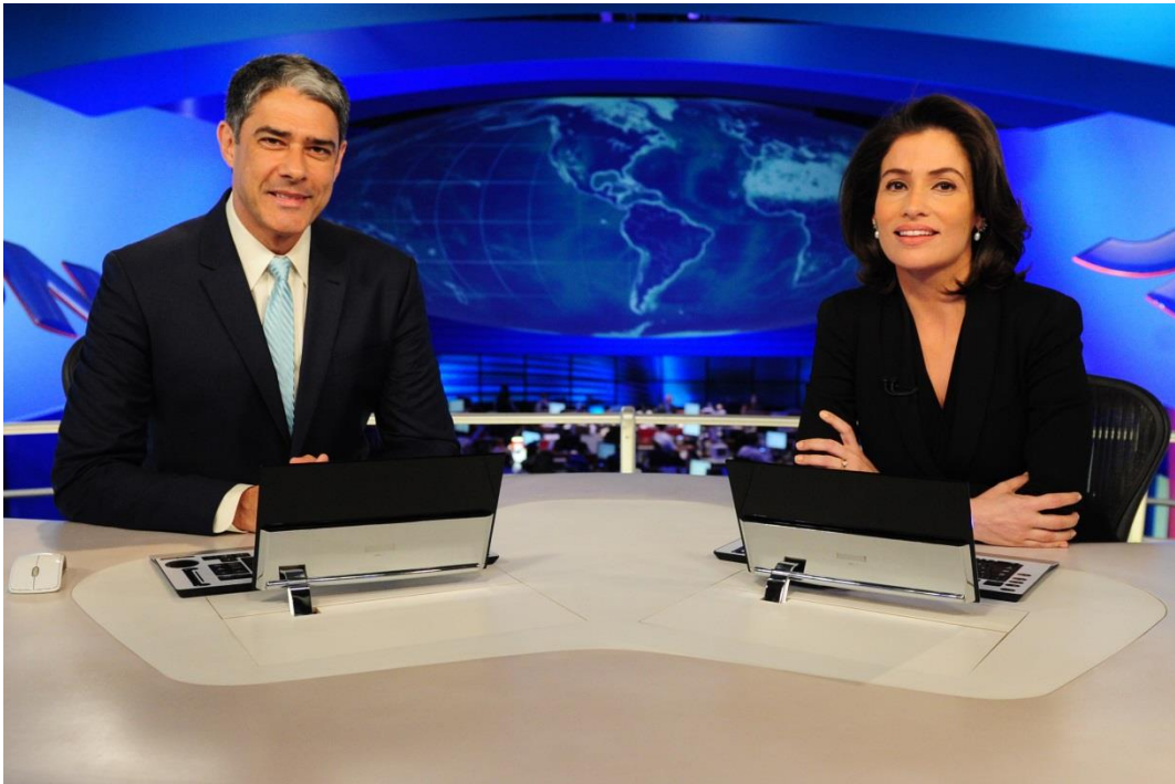
Foto 10 – William Bonner e Renata Vasconcellos na estreia dela como âncora do Jornal Nacional