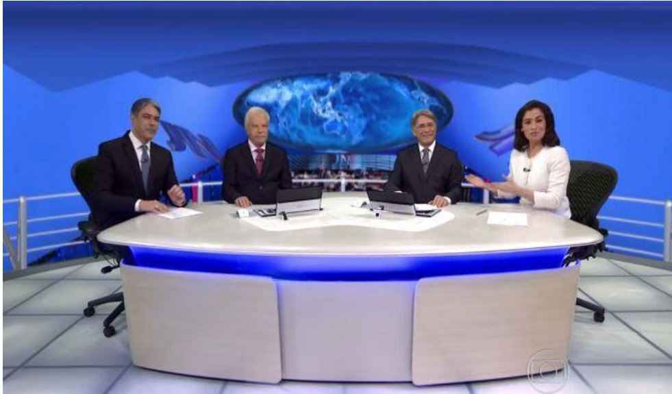
Foto 15 – Edição especial em comemoração aos 50 anos da TV Globo no dia 24 de abril de 2015.