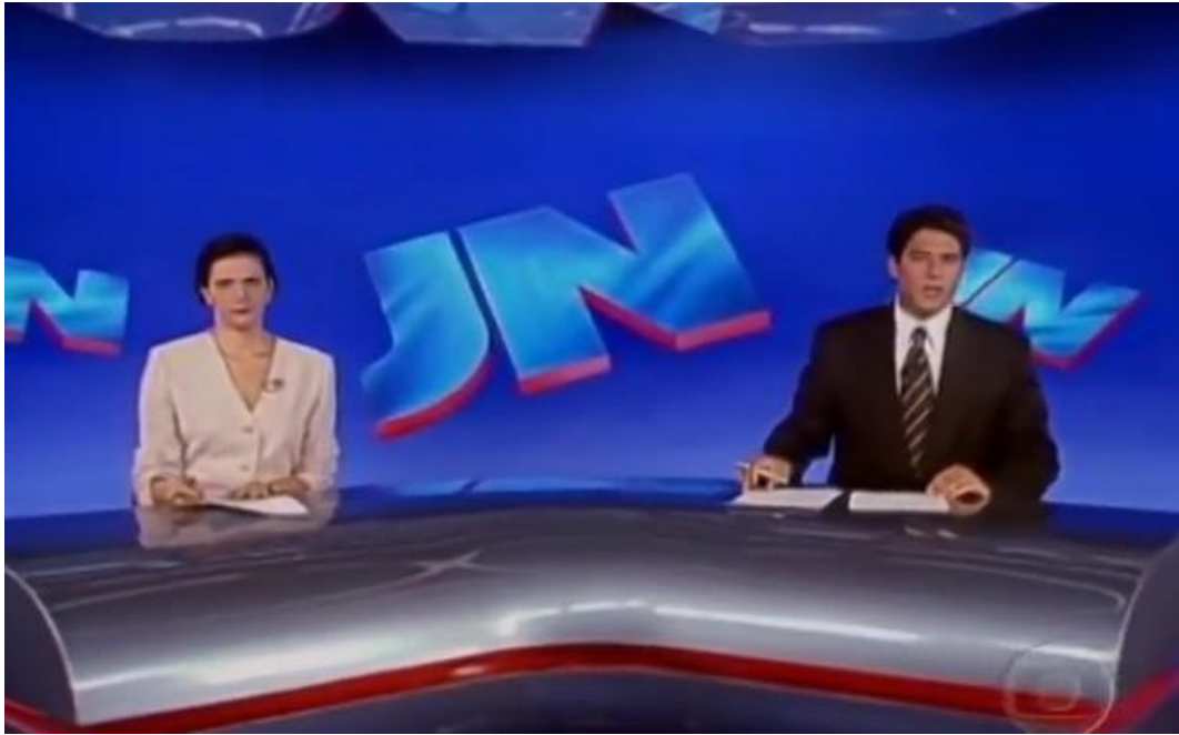
Foto 7 – Lilian Witte Fibe e William Bonner no Jornal Nacional , em 1996.