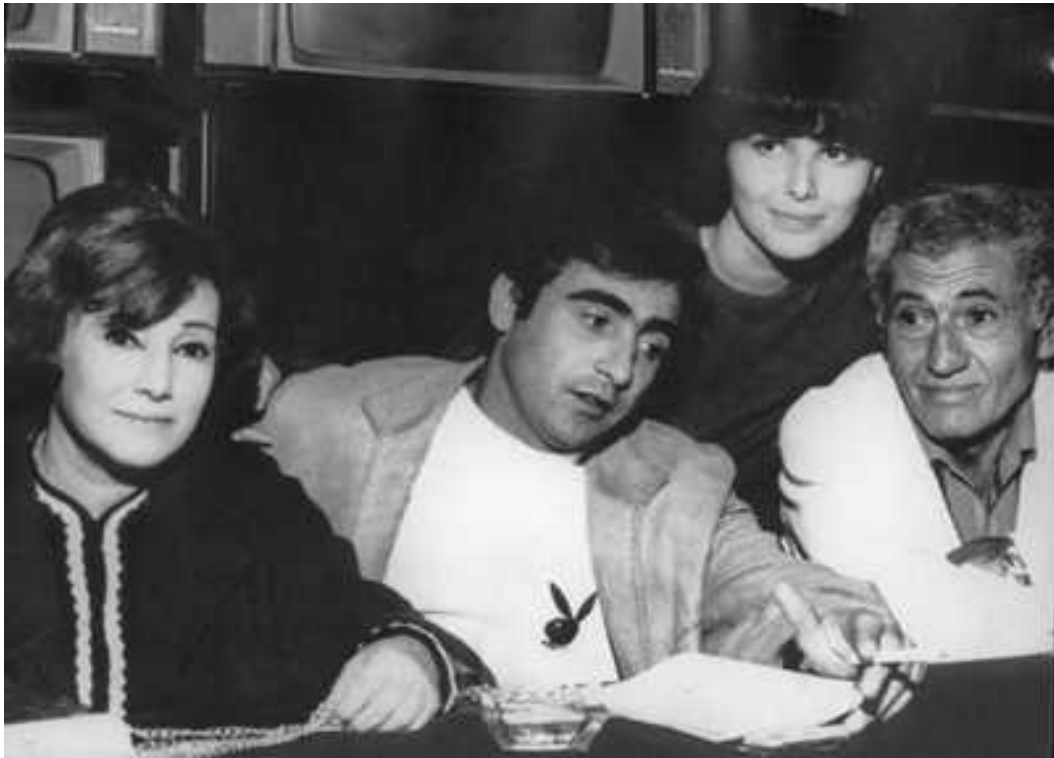
Foto 2 – Eleonor Bruno, Luiz Gustavo, Irene Ravache e Jofre Soares na novela Beto Rockefeller , em 1968.

um maior investimento, resultando numa homogeneidade cultural 5 . Mas não só de entretenimento vivia a televisão brasileira nos anos de 1960, o jornalismo também conquista seu espaço na tela, como veremos a seguir.