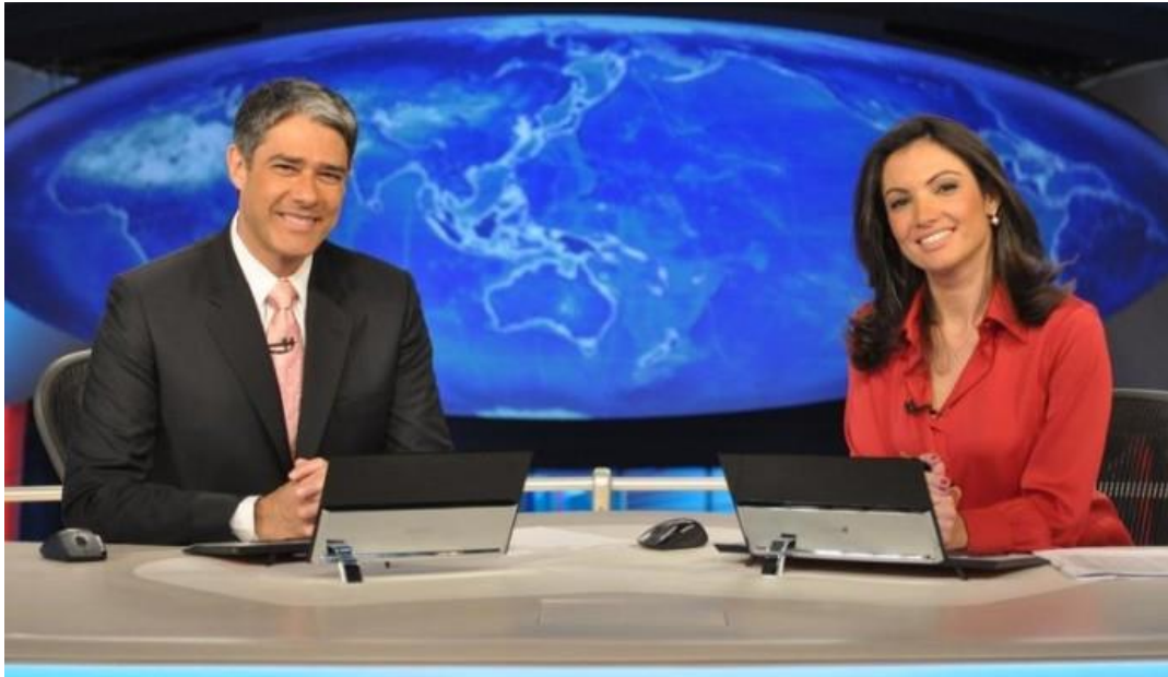
Foto 9 – William Bonner e Patrícia Poeta no Jornal Nacional , em 2011.