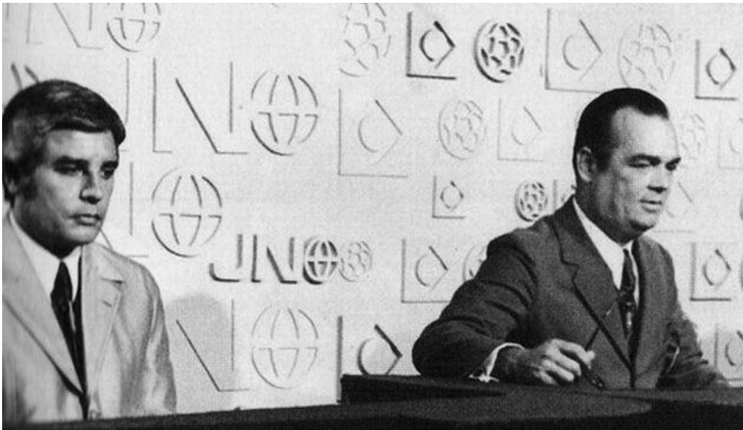
Foto 4 – Cid Moreira e Hilton Gomes no primeiro Jornal Nacional , em 1969.