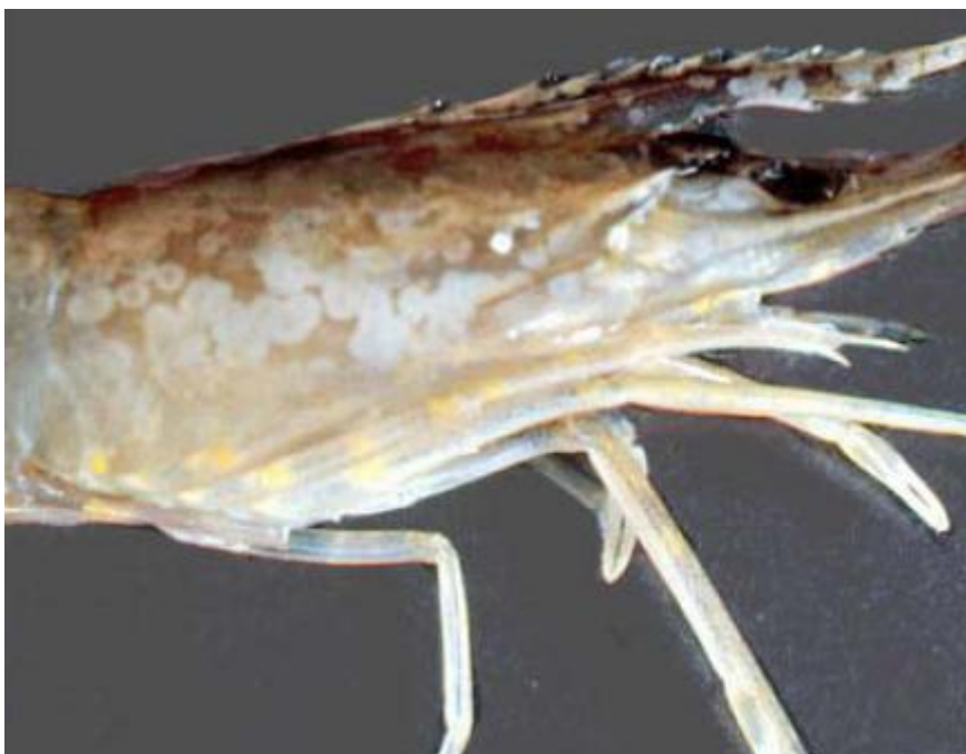
Figura 1 - Presença de manchas brancas na carapaça de um indivíduo de L. vannamei infectado com o WSSV.