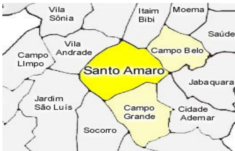
Figura 2 – Mapa da Subprefeitura de Santo Amaro.

Fonte: http://portal.prefeitura.sp.gov.br/subprefeituras/spmb/mapas/0001