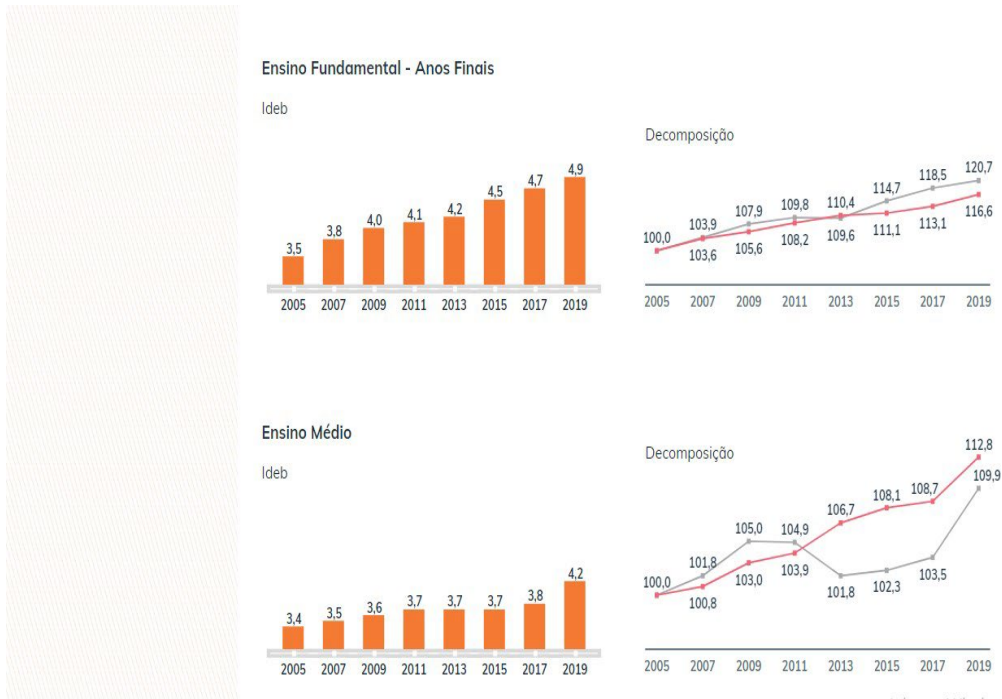
Gráfico 2

Assim, como demonstrado nos gráficos houve uma potencialização na melhoria dos níveis da educação nacional em toda a educação básica, desde os anos iniciais aos finais.