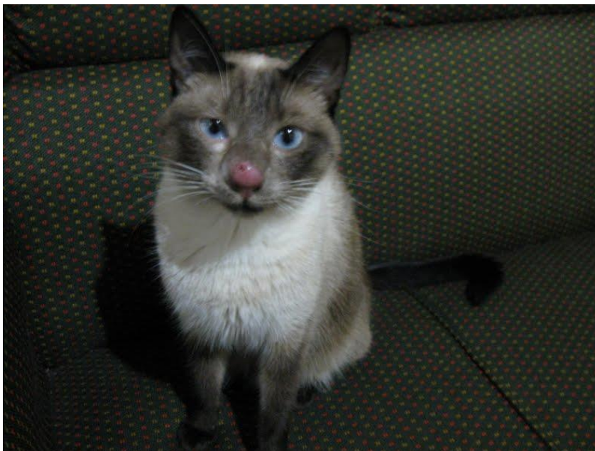
Figura 2 - Piora do quadro com aumento do plano nasal apresentando pele avermelhada e início de ulceração.