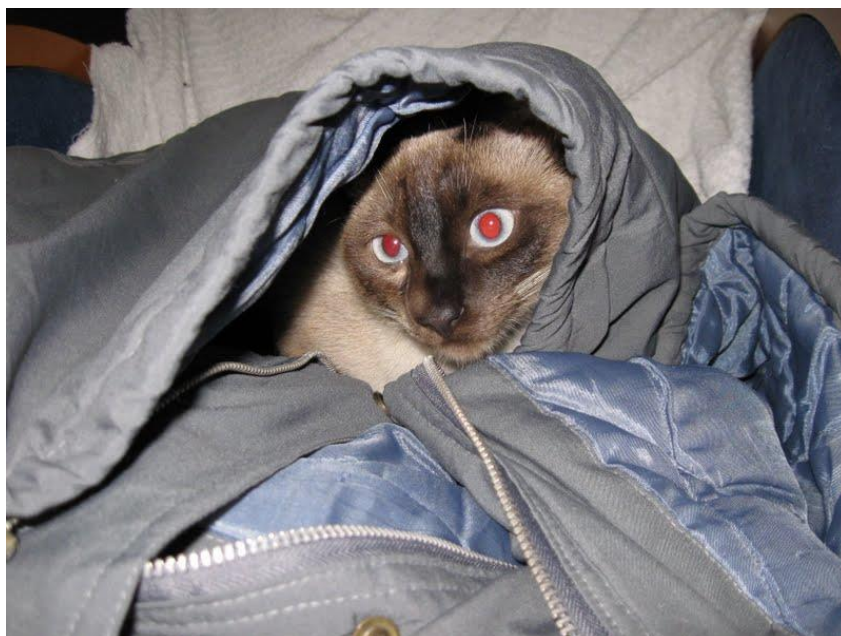
Figura 1 - início da doença com leve aumento do plano nasal.

No dia 14 de Abril de 2010, uma gata siamês com um ano e quatro meses de idade, peso 3,200 kg, castrada foi atendida numa clínica veterinária particular apresentando leve aumento de volume em plano nasal, coriza e lacrimejamento unilateral sem muco, espirro frequente, temperatura normal, apetite normal (Figura 1). Proprietário relatou observar frequentemente a presença de pombos na varanda em que a gata tem acesso.