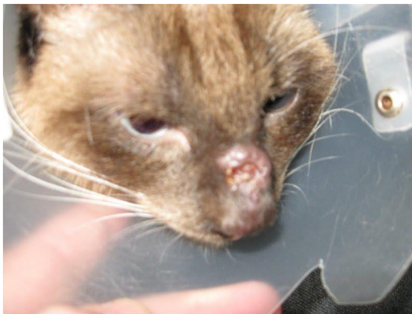
Figura 4 - Piora do quadro com grande área ulcerada e aumento de volume.