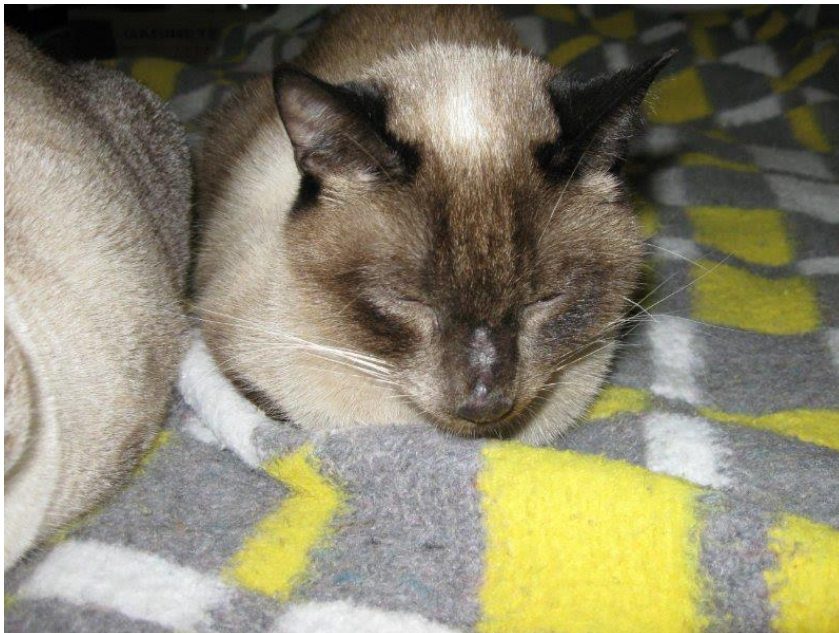
Figura 8 - Término da cicatrização após cirurgia.