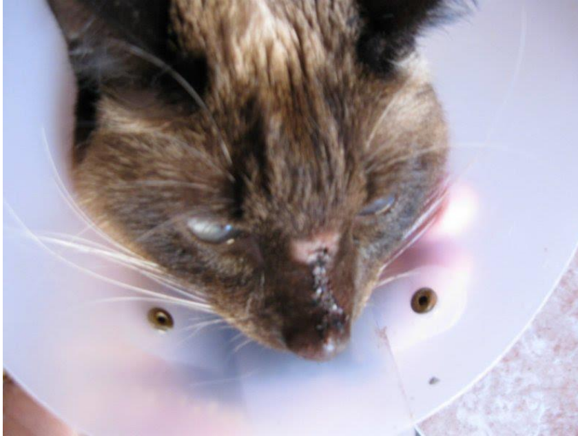
Figura 5 - procedimento cirúrgico de retirada do tecido exuberante e sutura.

Foi realizada a raspagem com retirada do tecido exuberante e sutura da pele em Outubro 2012 (Figura 5) e retomando o tratamento com Itraconazol 150 mg, uma vez ao dia, por seis meses seguidos.