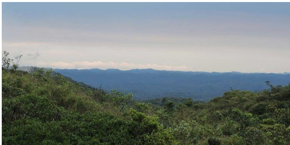
Figura 3. Núcleo Curucutu. Campos de Altitude. 2020.