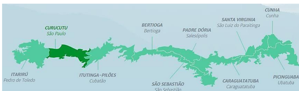
Figura 2. Núcleos administrativos do PESM, em destaque o Núcleo Curucutu.

Núcleo Curucutu possui uma área total de aproximadamente 37.518 hectares, abrangendo partes dos municípios de Itanhaém, Juquitiba, Mongaguá e São Paulo. Está localizado nas coordenadas geográficas 46° 44' 36" O e 23° 59' 06" S, no extremo sul do estado, a 70 km do centro da capital, sendo vizinho dos núcleos Itarirú e Itutinga-Pilões (Fig. 2). 10