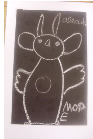
Medo da Morte