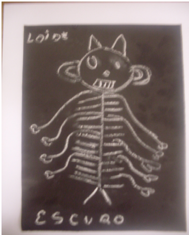
Medo do Escuro