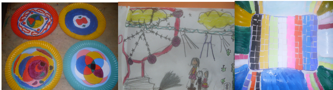
Desenhos e pinturas - turmas do ensino fundamental

“Experiência é aquilo que o fluxo da minha vida me fez pensar”