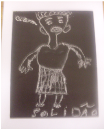
Medo da solidão