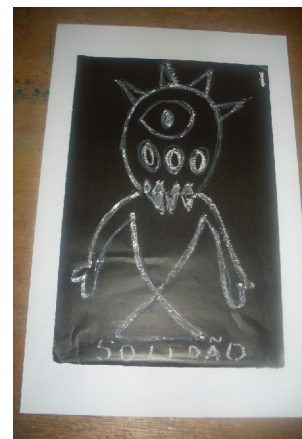
Medo da Solidão