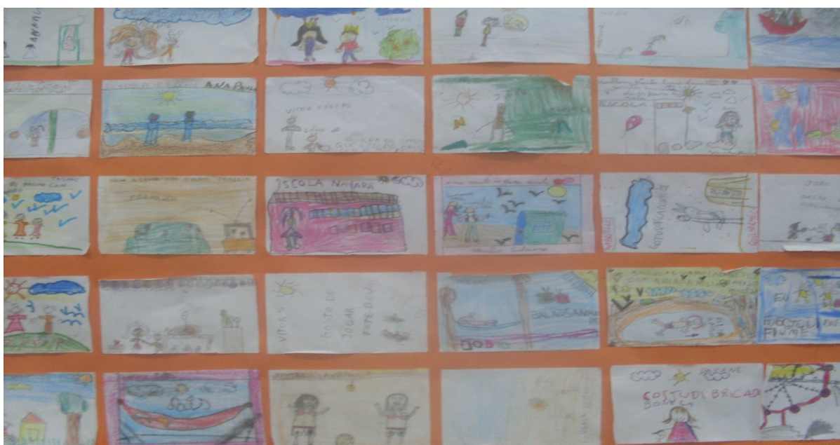
Painel realizado pelo 2º ano do ensino fundamental

O desenho representa em parte, a mente consciente e faz referência ao inconsciente. A criança transporta seu estado anímico ao papel.