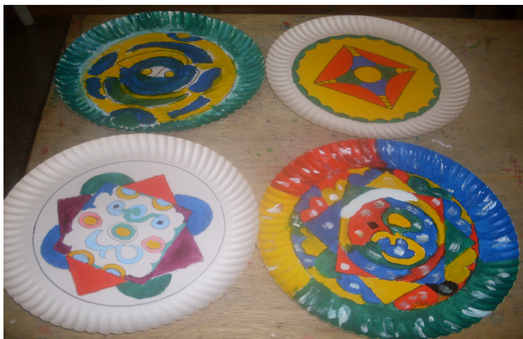
Pintura de mandalas