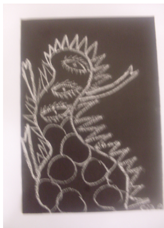
Medo das Drogas