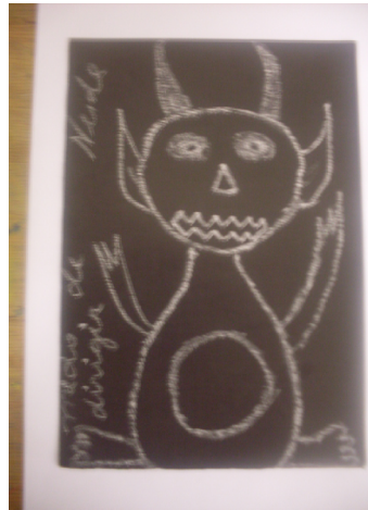
Medo da violência