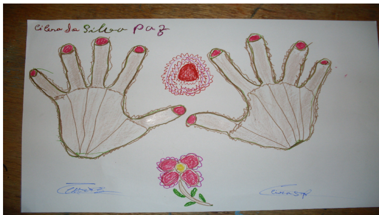
Colagem com barbante