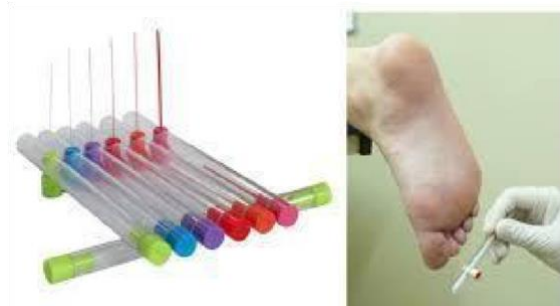
FIG.1 - ESTESIÔMETRO

https://www.dormed.com.br/estesiometro-para-teste-de-sensibilidade-sorri-bauru