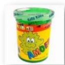
FIG.1 - SLIME

https://www.americanas.com.br/produto/51276274?pfm_carac=amoeba&pfm_index=22&pfm_page=search&pfm_pos=grid&pfm_type=search_page