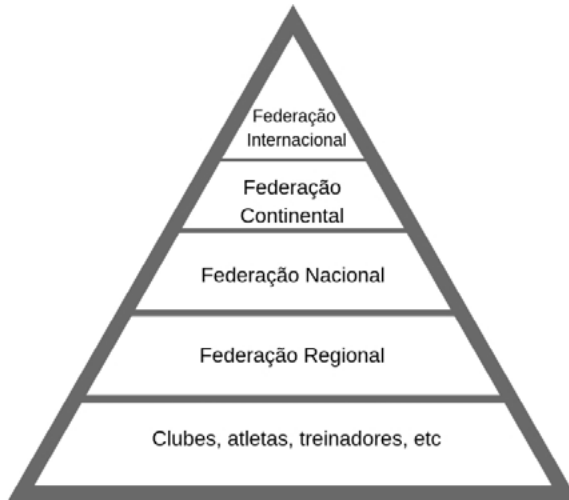
Figura 1: Pirâmide modelo federativo.