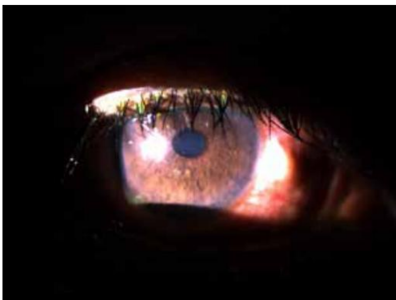
Imagem 1 – Glaucoma Agudo de Ângulo Fechado.

O glaucoma é classificado como a primeira causa de cegueira irreversível em países em desenvolvimento, como o Brasil 1 . É classificado por uma neuropatia óptica crônica definida pela degeneração progressiva do nervo óptico, que resulta numa perda da acuidade visual 2 . Dentre os tipos de glaucoma, é possível citar o glaucoma primário de ângulo aberto, o glaucoma primário de ângulo fechado, o congênito e o secundário ou corticogênico. O glaucoma primário de ângulo aberto e o glaucoma corticogênico, são condições crônicas as quais os ductos de drenagem são obstruídos por partículas, aumentando gradualmente a pressão ocular e causando lesão nos nervos 2 . Já no glaucoma primário de ângulo fechado, os ductos se tornam ineficientes porque o ângulo entre a íris e a córnea se tornam muito estreitos. O glaucoma secundário é resultante de outras condições desencadeantes, como catarata e uveíte. Por outro lado, o glaucoma congênito é proveniente de um defeito na formação do sistema de drenagem ocular, acarretando o aumento da PIO (Pressão Intraocular), já no nascimento ou nos primeiros dias de vida 2 .