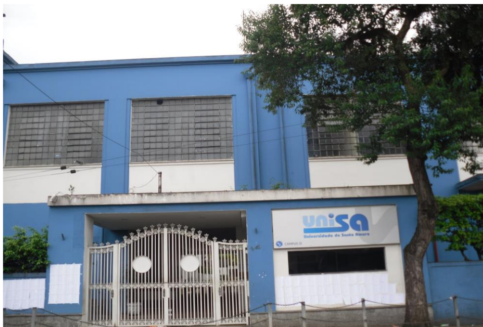
Fachada do Campus II- Unisa, Santo Amaro, SP