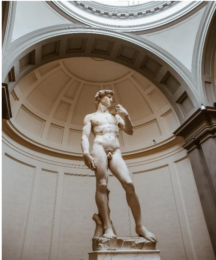
Figura 2: Davi, Michelangelo