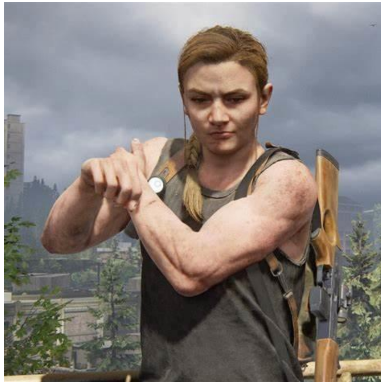
Figura 6 - Abby, The Last of Us 2

O mesmo tipo de reclamação pode ser observado no universo dos videogames quando, em 2020, lançou o segundo jogo da franquia de videogames da Sony/Playstation, intitulada de The Last of Us . Nele a protagonista Ellie Williams assume papel de destaque no lugar de Joel Miller e gerou revolta por parte do público que detestou a mudança, pois além de mulher a Ellie é lésbica. Além de incluir uma personagem abertamente homossexual, o jogo retrata também mulheres fora do padrão como a personagem Abby, que foge do estereótipo feminino ao ser representada de forma musculosa, e um personagem transexual que põe em debate a normatização de gênero, como apontado pela matéria do site Gamer Blast.