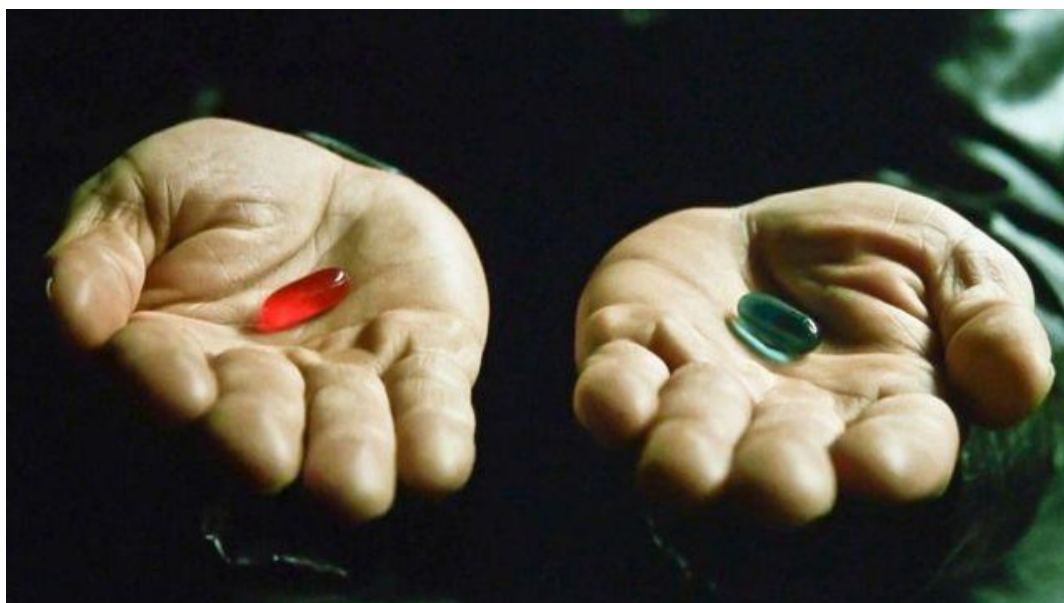
Figura 3 – Morpheus oferece as pílulas para Neo

eles acreditam ser a ‘verdade’ sobre o papel dos homens e das mulheres, especialmente no que diz respeito à dinâmica de poder, relacionamentos e o lugar do homem na sociedade. As próprias criadoras do filme Lana e Lily Wachowski, que são mulheres transexuais, criticaram a associação do filme com o movimento redpill , dizendo que a narrativa original do filme era sobre liberdade, identidade e a busca por si mesmo, não uma luta anti movimentos progressistas.