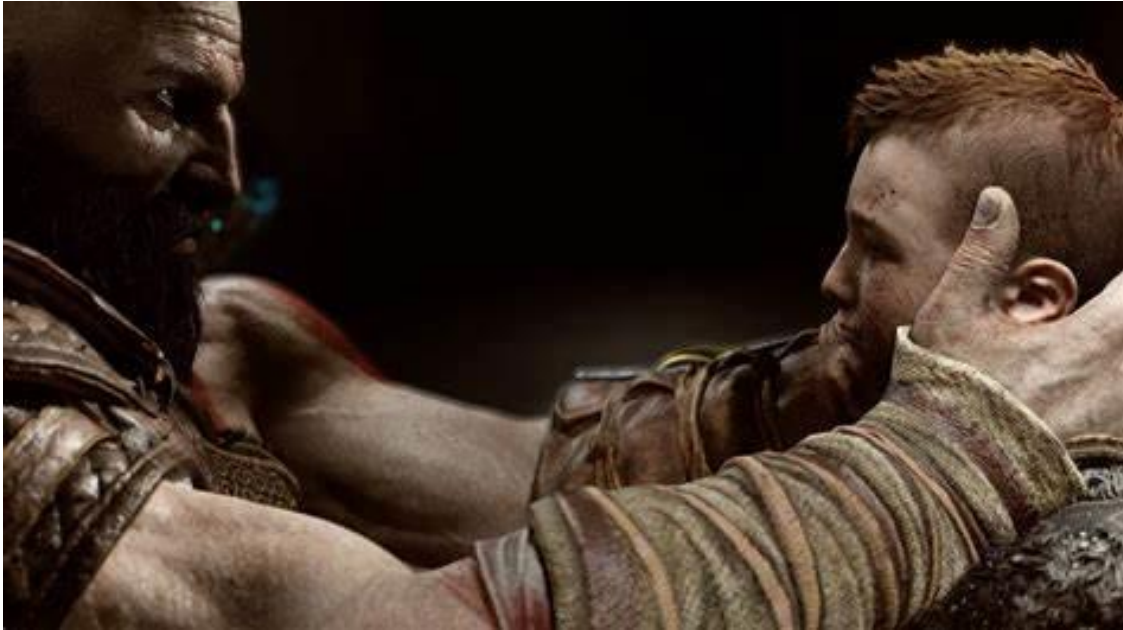
Figura 11 – Kratos ensinando Atreus a controlar a raiva

esforço reflete uma mudança crucial na forma como Kratos lida com sua masculinidade: ele reconhece que o caminho da violência não trouxe paz ou redenção, mas apenas mais dor, por fim, se torna um pai que tenta ensinar moderação, sabedoria e controle emocional, em contraste com a figura de autoridade impiedosa que ele um dia fora.