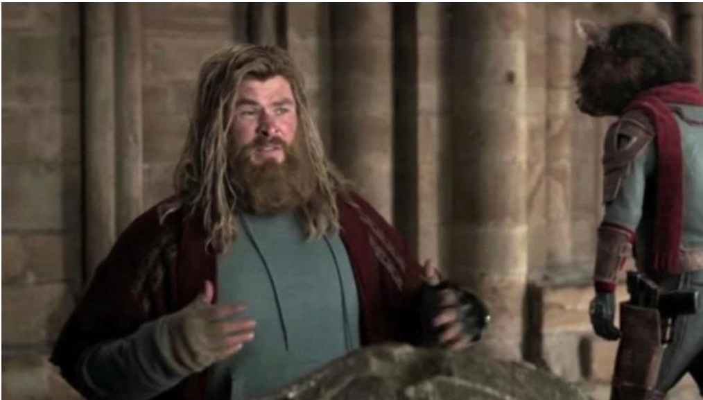
Figura 9 – Thor em um momento de fragilidade