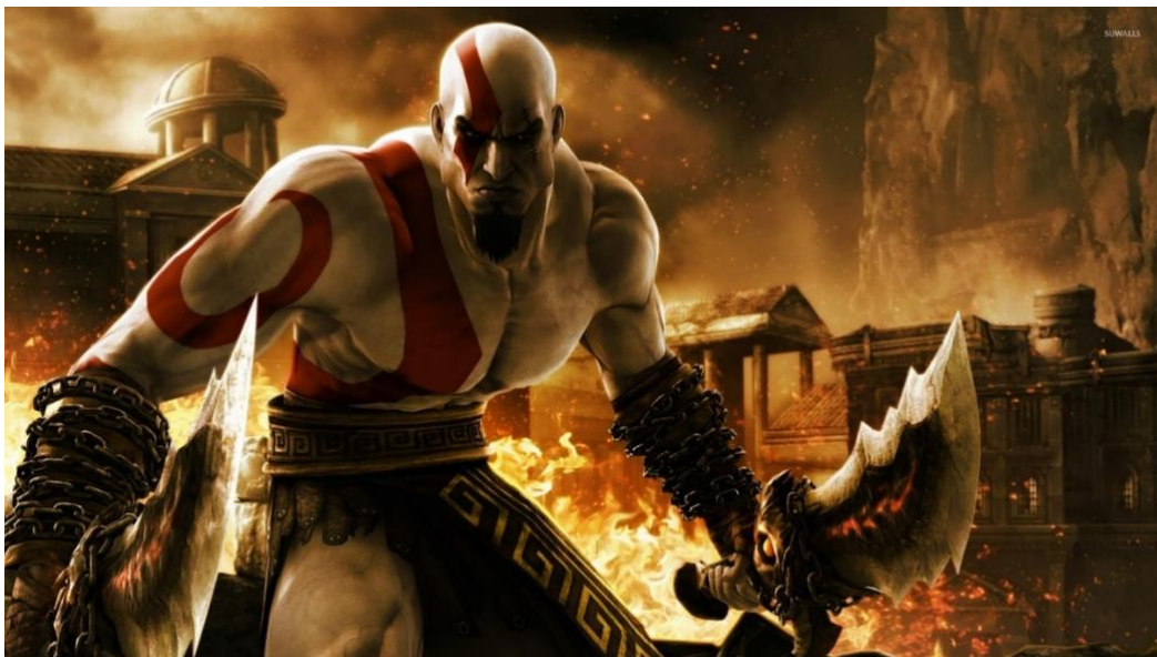
Figura 10 – Kratos destruindo Olimpo

vemos sua evolução ao romper com o ciclo de violência. Nos primeiros jogos da franquia God of War , Kratos era o símbolo perfeito da masculinidade hegemônica e da masculinidade tóxica, representava a força física extrema, a raiva incontrolável, a vingança e a incapacidade de lidar com emoções de forma saudável. Kratos canalizava sua dor e perda (a morte de sua esposa e filha, por exemplo) em uma série de ações violentas, perpetuando um ciclo de destruição. Esse comportamento, no entanto, é retratado como algo que não apenas destrói os outros, mas também a si mesmo, a violência é uma resposta comum para a dor e a impotência nos homens que se sentem forçados a esconder suas emoções e que veem a força física e a agressividade como as únicas saídas. No caso de Kratos, o ciclo de violência o consome, levando-o a matar deuses, destruir mundos e perder partes essenciais de si mesmo ao longo do processo.