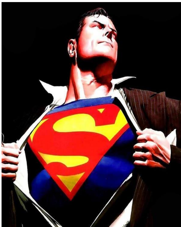
Figura 1 - Superman hiper-realista de Alex Ross