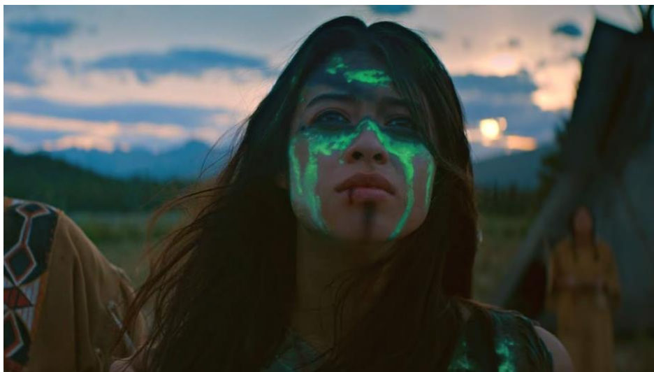
Figura 5 – Naru, Predador: A caçada (2022)