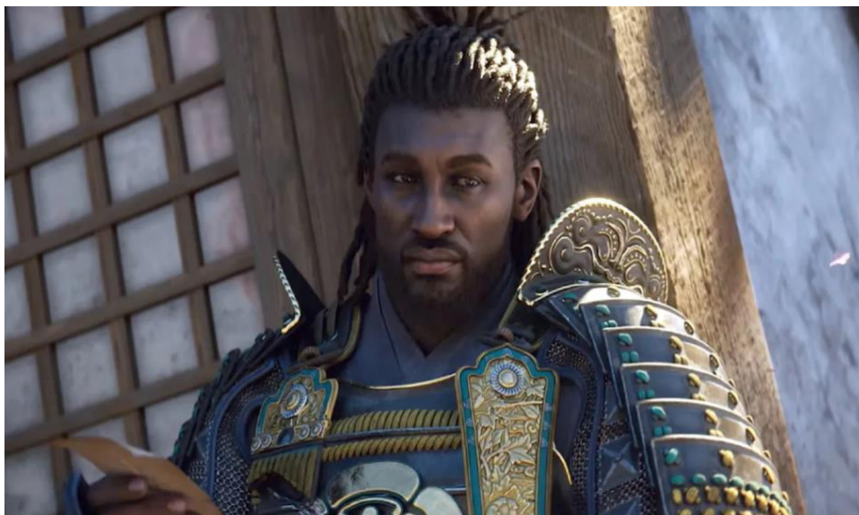
Figura 7- Yasuke, Assassin's Creed Shadows

Vale ressaltar o mais recente caso, que é o do mais recente protagonista da série de jogos da empresa francesa Ubisoft intitulada 'Assassin's Creed'. O último jogo da franquia que tem previsão de lançamento para 2025 ambientado no Japão do século XV, será protagonizado por 2 personagens, o samurai Yasuke e a ninja Naoe. As discussões em torno do jogo foi a legitimidade da condição de samurai do Yasuke que é um ex-escravizado que foi apadrinhado pelo senhor feudal Oda Nobunaga. Yasuke é um personagem histórico retratado em inúmeros contos e foi intitulado como o único samurai negro do Japão. Esse fato foi suficiente para que a comunidade classificasse o jogo como lacração, pois não há 'fontes históricas suficientes para dizer que Yasuke era de fato um samurai'.