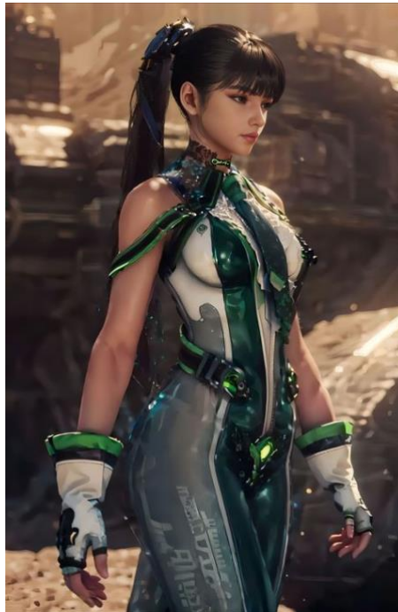
Figura 8 – Eve, Stellar Blade