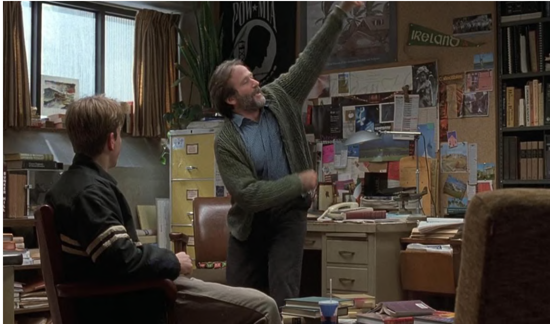
Figura 5 - Cena 5: Quarta Sessão, Jogo de Beisebol – 1'04''30''