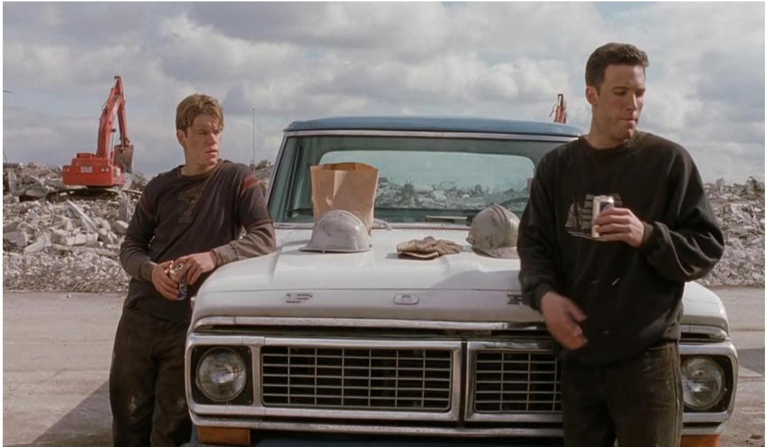
Figura 8 - Cena 8: Conversa com Amigo – 1'43''40''