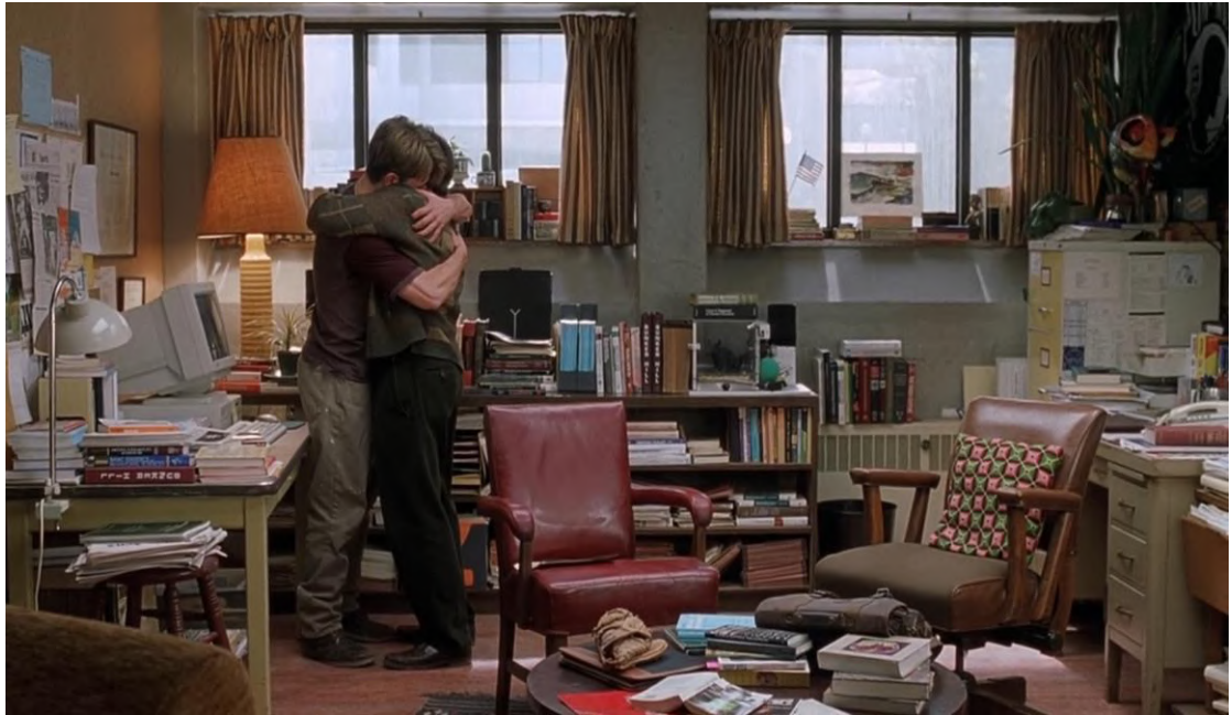
Figura 09 - Cena 09: Contato com História de Will – 1'50''38''