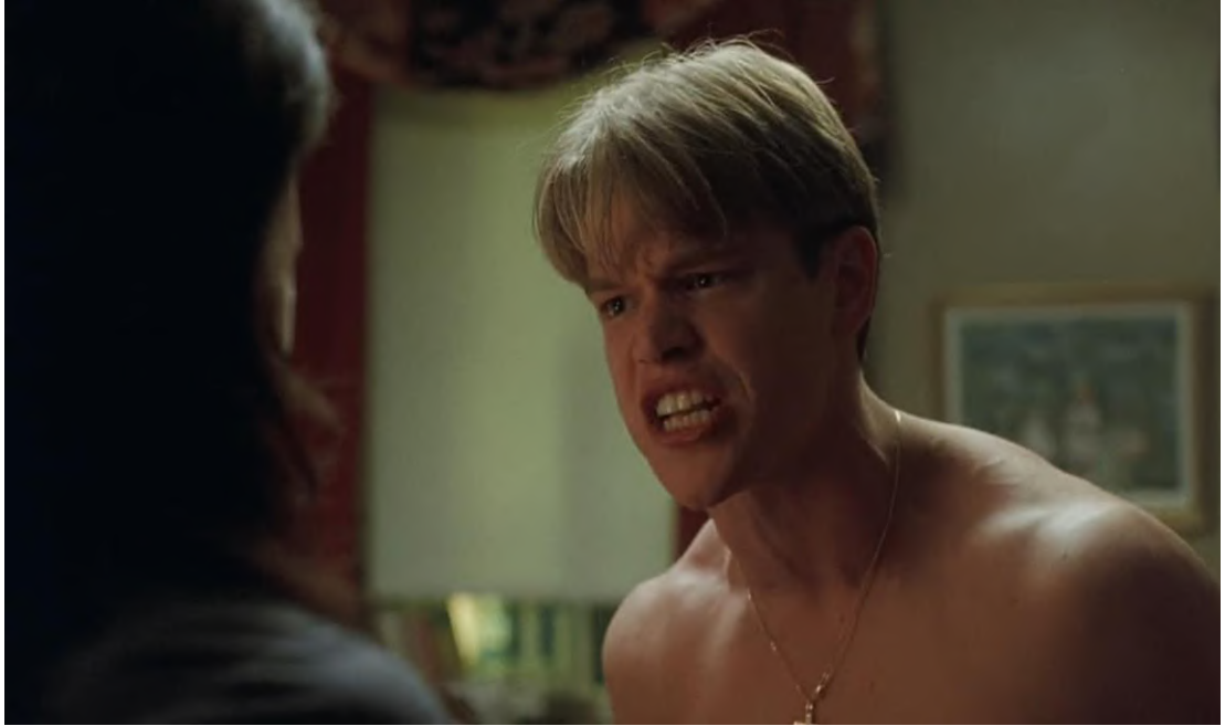
Figura 6 - Cena 6: Briga com a Namorada – 1'25''48''