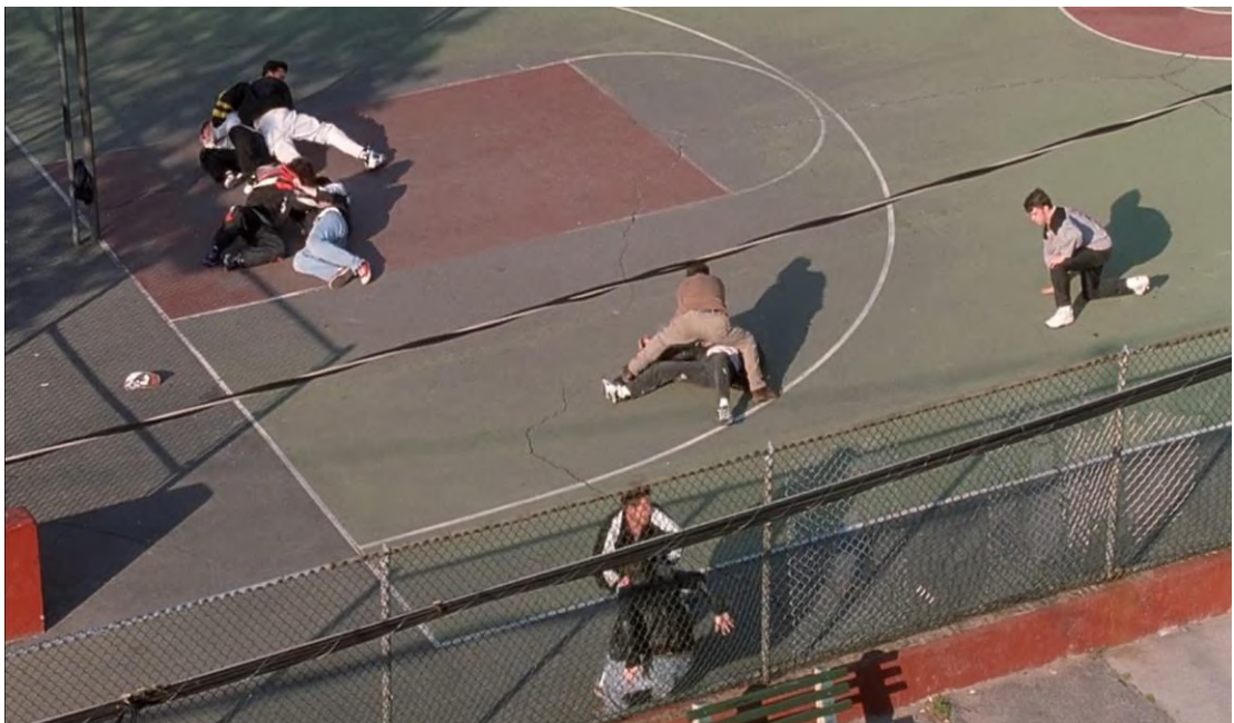
Figura 1 - Cena 1: Briga na Quadra – 11”50”

Foram selecionadas algumas cenas para que seja possível observar as relações familiares, amorosas, sociais e socioculturais do personagem Will Hunting e seu estado emocional, sua autopercepção e os comportamentos do personagem que ajudarão a compreender os fatores de risco que permeiam as comunicações. Serão apresentadas as cenas juntamente com a análise.