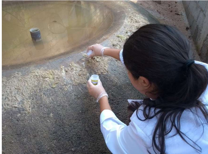
Figura 19 – Procedimento de coleta de amostra de fezes