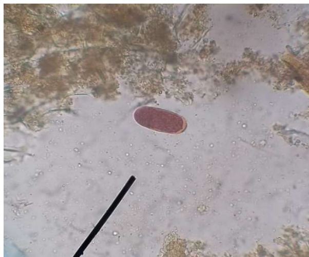
Figura 23 – Ovo do verme cecal Heterakis spp.