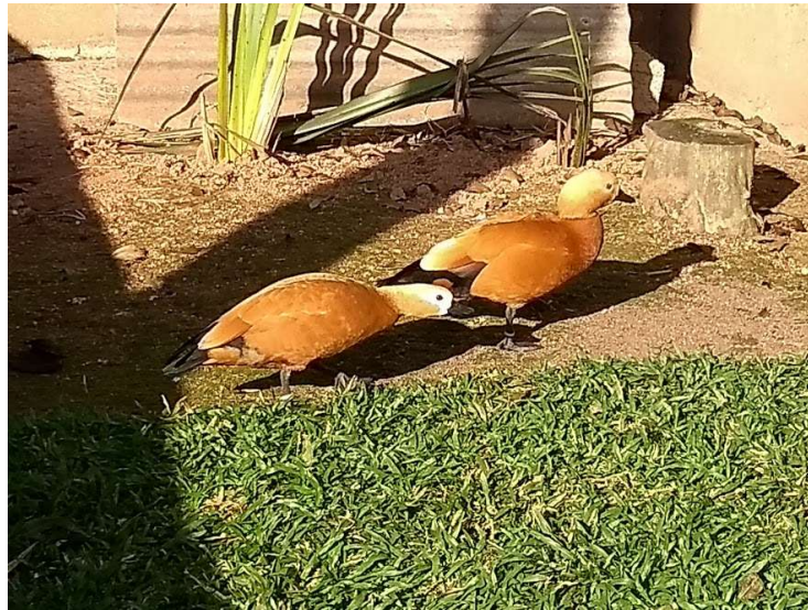
Figura 2 – Casal da espécie Tadorna ferrugínea