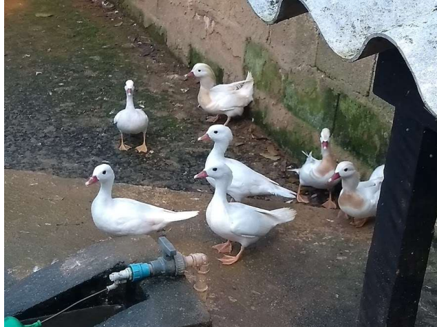
Figura 13 – Anatídeos da espécie Aix galericulata

frutos do mar, tendo preferência por se alimentarem no período da manhã ou fim da noite (TRUJILLO, 2012).