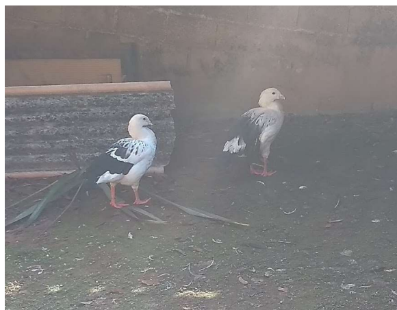
Figura 10 – Casal da espécie Chloephaga melanoptera