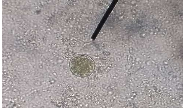
Figura 24 – Oocistos de Eimeria spp.