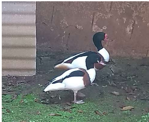
Figura 6 – Casal da espécie Tadorna tadorna