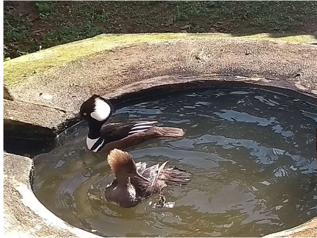
Figura 8 – Casal da espécie Lophodytes cucullatus