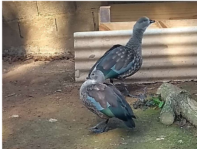
Figura 12: Casal da espécie Anser abyssinia