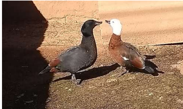
Figura 11 – Casal da espécie Tadorna variegata