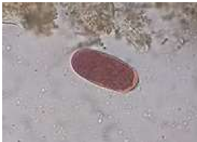
Figura 14 – Ovo de Heterakis spp

Fazem parte da ordem Ascaridida, que tem como famílias a Heterakidae e Ascaridae , as quais pertencem os gêneros Heterakis spp e Ascaridia spp (CORRÊA, 2007).