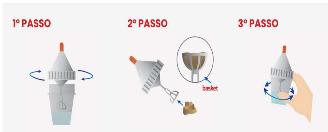
Figura 18 – Procedimento explicativo de coleta das amostras

Para o diagnóstico coproparasitológico, as amostras foram coletadas em formato de pool de fezes (quantidade suficiente para encher o basket do frasco) de cada recinto da criação, através do uso de frascos de testes diagnósticos Coproplus® fornecidos pela empresa NL Diagnóstica, os quais já possuem conservante SAF (ácido acético 2%, acetato de sódio, formalina 4%, água deionizada), agitadas em movimentos circulares e levadas para análise em laboratório, conforme representado na figura abaixo.