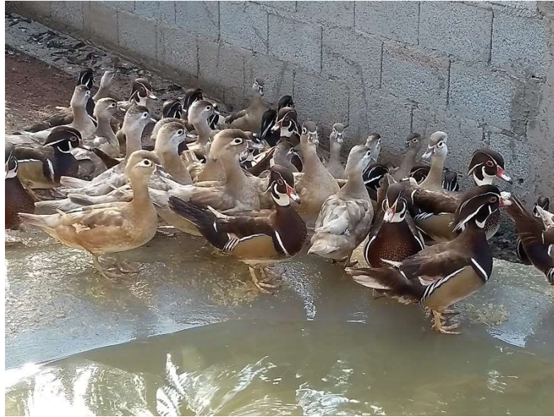
Figura 1 – Animais da espécie Aix sponsa