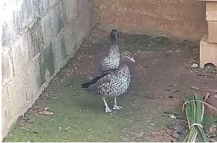
Figura 5 – Casal da espécie Chenonetta jubata