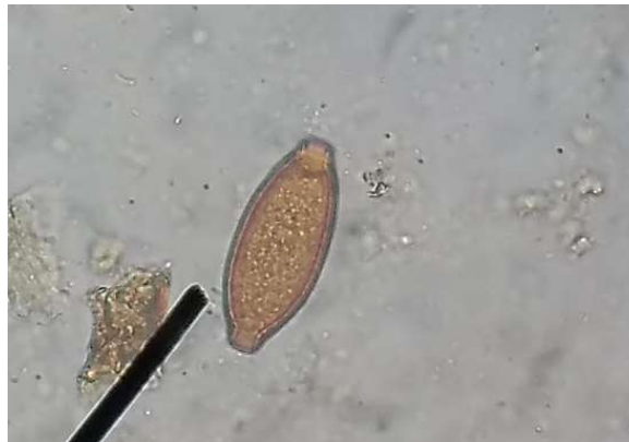
Figura 15 – Ovo de capilaria

A capilariose é uma infecção parasitária causada por um parasito Nematóide do gênero Capillaria . Podem ser encontrados em diversos tipos de aves, sendo mais comum em psitacídeos, passeriformes, galiniformes, entre outros. Sendo mais frequente em locais com grande densidade populacional e locais contaminados (MACHADO, 2014).