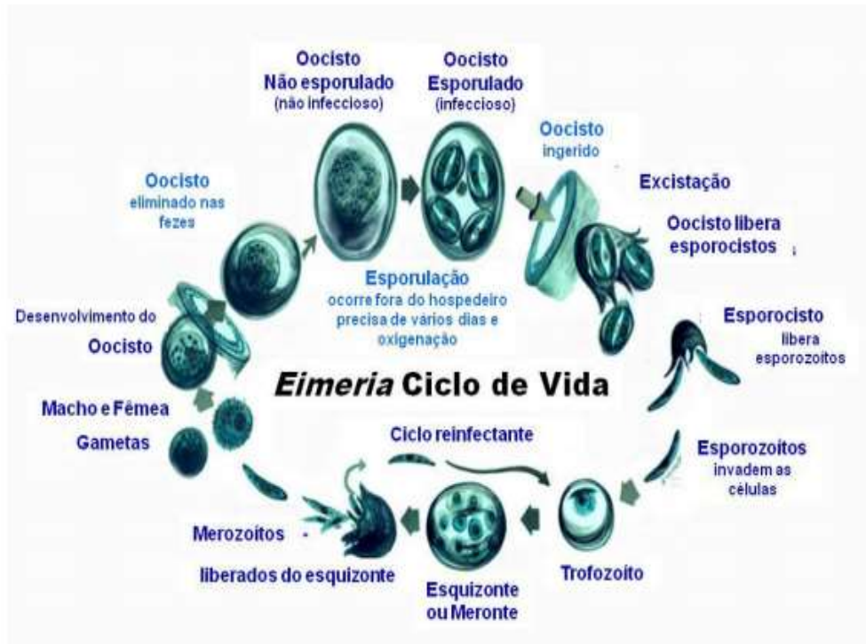
Figura 16 – Ciclo de vida Eimeria

conformação das vilosidades intestinais, variando de acordo com a densidade e a localização dos parasitos (KAWAZOE, 2000).