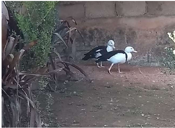
Figura 9 – Casal da espécie Tadorna radjah