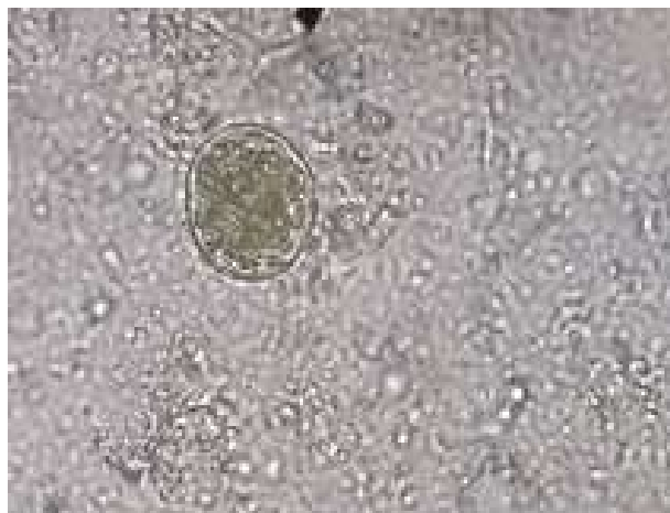
Figura 17 – Ovo de Eimeria spp.