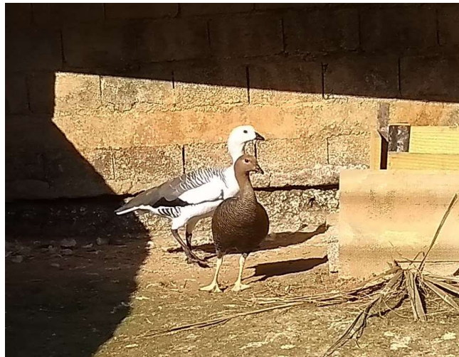
Figura 7 – Casal da espécie Chloephaga picta