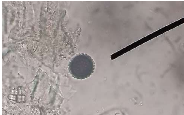
Figura 25 – Ovo de Balantidium