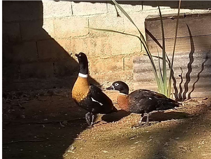
Figura 3 – Casal da espécie Tadorna tadornoides