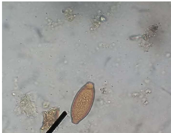
Figura 22 – Ovo de Capilaria spp.