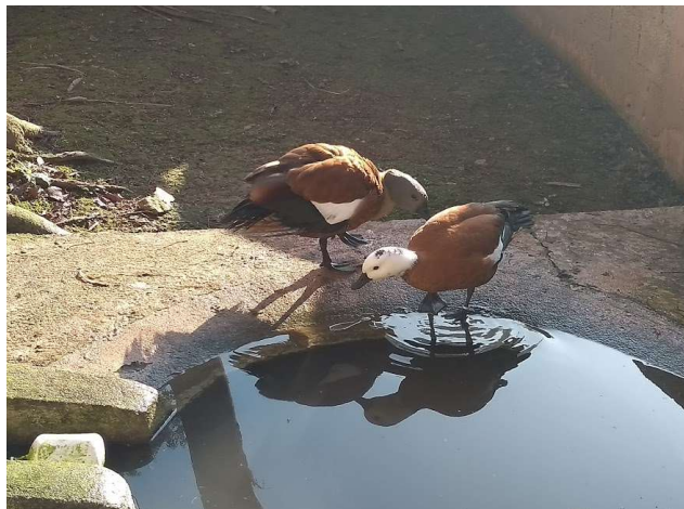
Figura 4 – Casal da espécie Tadorna cana

Tadorna cana ou Pato da Cabeça Cinzenta, como são conhecidos popularmente, são aves típicas da África do Sul (Figura 4). Podem atingir até 64 centímetros de comprimento e possuem dimorfismo sexual, sendo nos machos visível a presença de penas acinzentadas na cabeça e a fêmea uma face branca com coroa preta (GELDENHUYS, 2015).