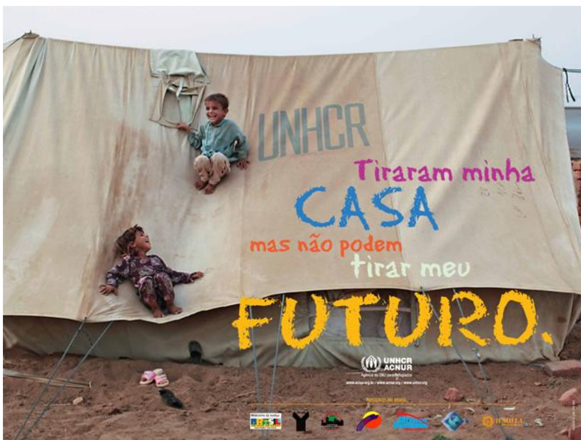
Figura 8 Dia Mundial do Refugiado 2010: Cartaz do ACNUR

Fonte: © ACNUR/. Disponível em: Disponível em: http://www.acnur.org . Acessado em 15 abr 2011.