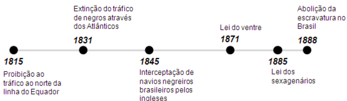
Figura 1 – Da proibição ao término da escravatura

A Inglaterra tinha interesses financeiros em jogo, que eram apoiados pela classe burguesa industrial, a fim de enfraquecer as regiões coloniais, produtoras agrícolas e anular as leis que davam a essas áreas o monopólio do comércio de gêneros agrícolas, para assim, se alavancar financeiramente sobre os outros países. Conforme figura abaixo a qual se datam os primeiros tratados da Inglaterra com o intuito da proibição do tráfico de escravos: